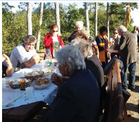
Emlékdélután a hegyen 10. oldal