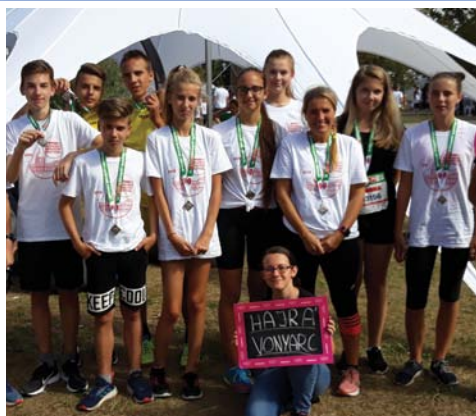
Spar maraton 9. oldal