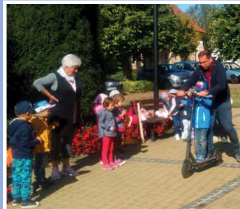
Ovis tanulmányút 12. oldal