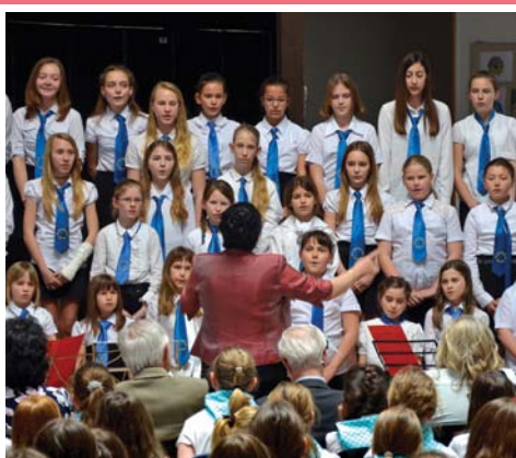
Már 6 kórus vett részt a kórusalálkozón 6. oldal