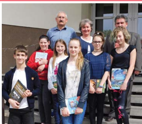
Költészet napi versmondó verseny 6. oldal