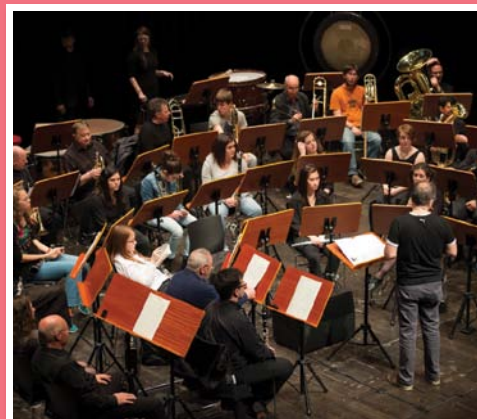
Olasz zenekar látogat településünkre 7. oldal