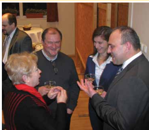
Újévi koccintás 2. oldal