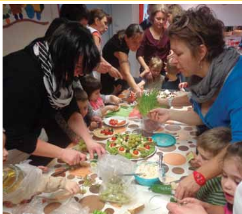
„Téli lakoma” az óvodában 8. oldal