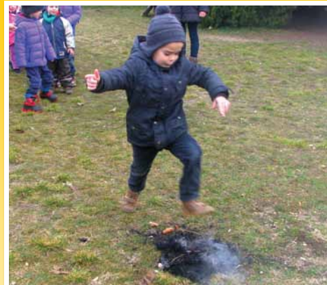
Óvodai farsang 8. oldal