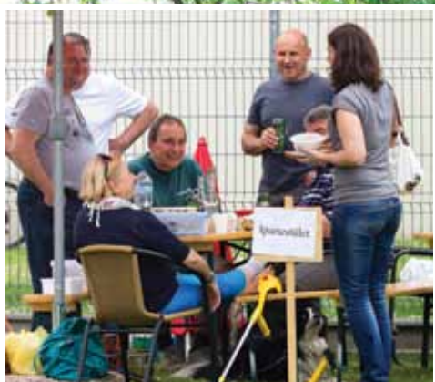
Májusi Piknik 9. oldal