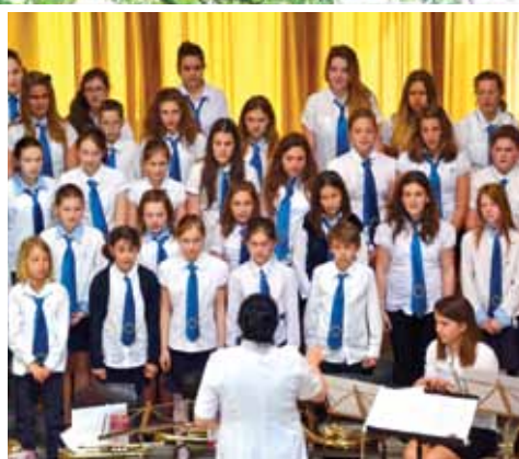
XXV. Kórustalálkozó 10. oldal