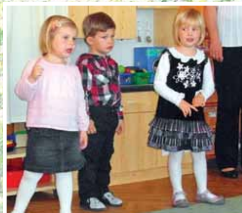
Anyák napja az óvodában 10. oldal