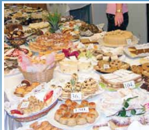
Házisütemény-sütő verseny 8. oldal