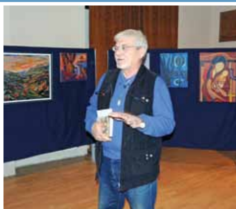
A Balaton Art őszi tárlata 7. oldal