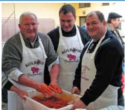
Vonyarcvashegyi Disznóvágás 2. oldal