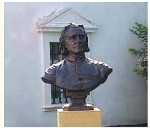
Liszt Ferenc tanulmányút