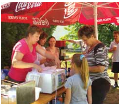
Családi piknik – Gyermekeknapon