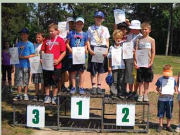
I. korcsoportosok eredményhirdetése Veszprémben