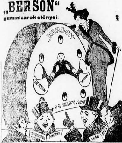
rendkívül tartós kiválóan rugalmas formája ideális