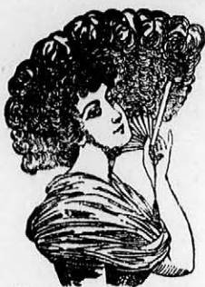
ezedobor... 2.46... at svrt, vagy a... 2.46... és beki... dese