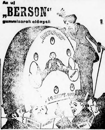
rendkívül tartós kiválóan rugalmas formája ideális

* Az iparfelügyelő és a Munkáspénztár. A kereskedelmi miniszter rendeletet intézett az iparfelügyelők-höz. A rendelet szerint az üzemekben tapasztalt, beteggyógyezésre vonatkozó észrevételeiket, balesetek elhárítására tett óvrendszabályait, vagy más megjegyzéseiket közölni tartoznak a kerületi munkásbiztosító pénztárral. A balesetek után elrendelt intézkedések szövszerinti szövegét a rendelet értelmében az iparfelügyelők ezentul megküldik a munkásbiztosító pénztáraknak, továbbá a gyárvizsgálat alalmával észlelt összes hiányokról értesítik a munkásbiztosítót. Az óvintézkedések megfelelő végrehajtásáról is értesíti az iparfelügyelő a munkásbiztosítót.