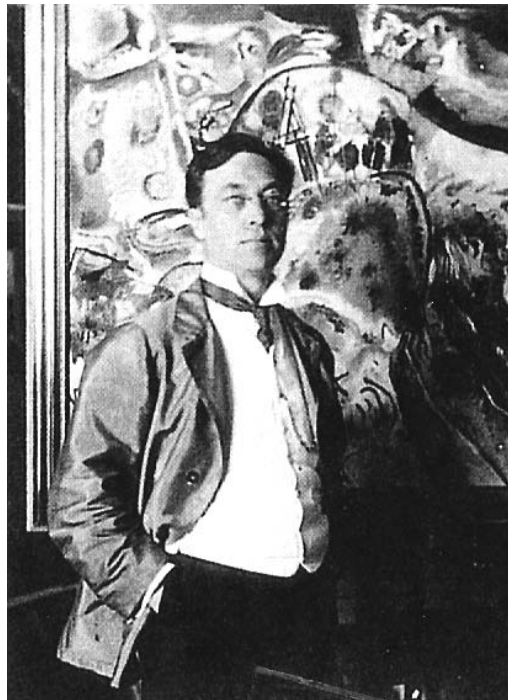
Kandinszkij 1913-ban Münchenben az Apró örömök festménye előtt

A kiállítás kapcsán felmerülhet a kérdés, vajon miért, hogyan és mikor került ki rengeteg műve az Egyesült Államokba, hiszen a művész sosem járt Amerikában, bár erre több lehetősége is nyílt volna. 1931-ben New Yorkba, 1935-ben pedig Észak-Karolinába kapott meghívást tanári állásra. 1940-ben, amikor New Yorkban megalakult a nácizmus elől menekülőket segítő hálózat, a Modern Művészetek Múzeumának igazgatója felajánlotta, hogy segítenek neki elhagyni Európát, úgy, ahogy azt tették számtalan művésszel. A szomorú statisztika szerint, 1933-tól 1944-ig mintegy 700 művész és 380 építész emigrált az Egyesült Államokba, nem beszélve a tudósok nagy számáról. Ennek tudatában, csak egyetérthetünk Wigner Jenő mondásával, miszerint: „Adolf Hitler igazán pompás emlékművet érdemelne az Egyesült Államoktól az amerikai