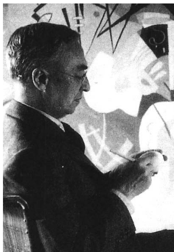
Kandinszkij 1939-ben az Uralkodó ív című festménye előtt

mon Guggenheim-alapítványt 1937-ben hozták létre, melynek élére természetesen Rebay került. Vezetése alatt a válogatás gyorsan bővült, folyamatosan kiegészítésre kerültek az addig alulreprezentált területek.