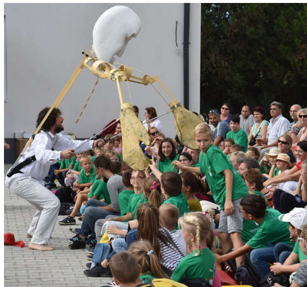
Almagránát - a Soltisz Lajos Színház előadásában

Sopronkövesd község Önkormányzata és a Sopronkövesd Fejlődéséért Egyesület értesíti a közép- és felsőoktatási intézmény nappali tagozatán tanulókat , hogy az iskolakezdsre tekintettel támogatásban részesülhetnek, ha tanulói, hallgatói jogviszonyukat iskolalátogatási bizonyítvánnyal igazolják. Az iskolalátogatási igazolás eredeti példányát az Önkormányzati Hivatalban, 2018. november 5-ig lehet benyújtani.