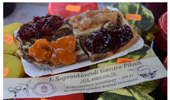
I. Sopronkövesdi Gasztró Piknik 2018. augusztus 18.