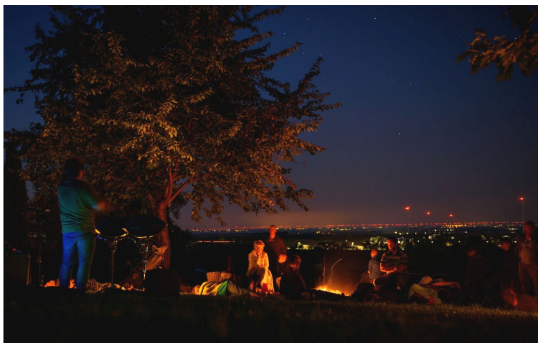
KÖN záró program a Kötecsben