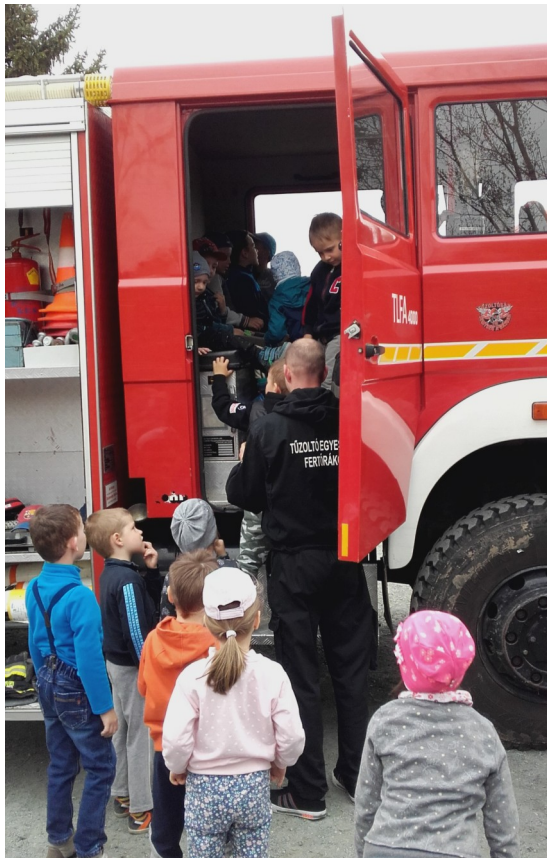
Tűzoltók az oviban