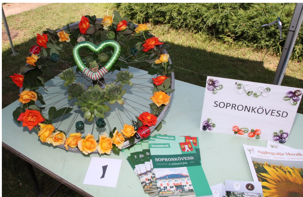
Küöldíjjal jutalmazott virágdekoráció