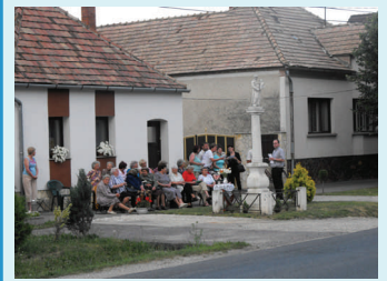
Litánia a Szt. Antal szobornál

Figyelje a postaládáját! Szeptemberben mindenki számára elérhetővé válik a Kulturális Örökségvédelmi Napok teljes programja, melyre minden érdeklődőt szeretettel várunk!