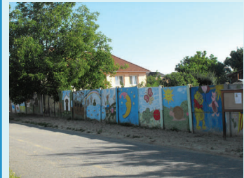
Kiszínesedtek a kerítések a játszótér mellett.