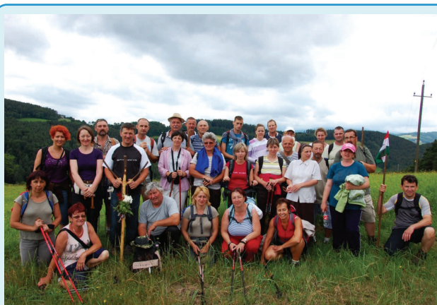
A máriacelli zarándoklat résztvevői.

Rendkívül nagy teljesítmény, főképp olyan emberektől, akik nem tesznek meg ekkora távokat rendszeresen. Csak hogy tisztázzam, általában 40 km-es távot tesznek meg naponta. Olvasatomban a zarándoklat arról szól, hogy az ember elindul egy cél felé, amely egy szent hely. Vallási meggyőződésből teszi, mély hittel. Az út során haladva és maga mögött hagyva a kilométereket, egyre nehezebb, fáradnak az izmok és