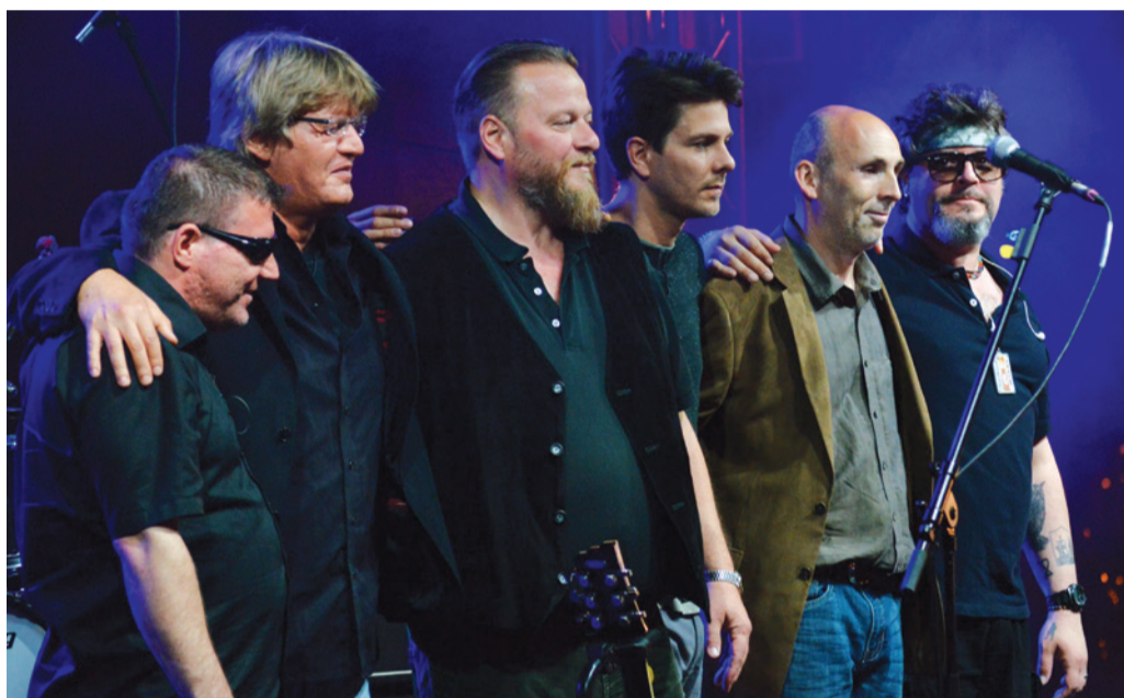
Ismerős Arcok-koncert a Szentháromság téren 2016-ban, a Nemzeti Összetartozás Napja alkalmából