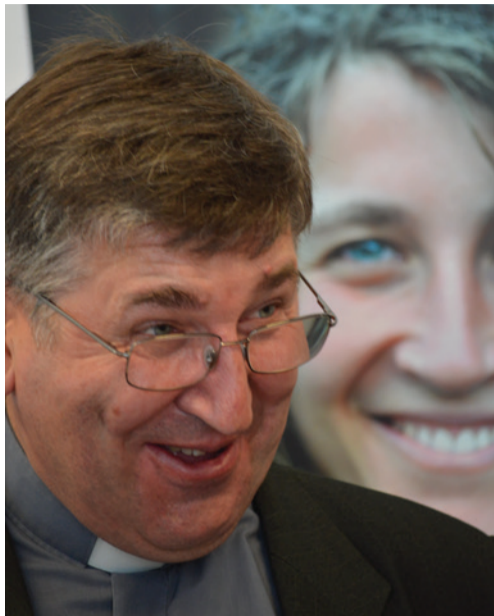
A Mi, magyarok kiállítás megnyitóján

A Nemzeti Összetartozás Napja (június 4.) és az intézmény fennállásának tízéves jubileuma alkalmából fényképek, plakátok és címlapok felvillantásával tekintünk vissza a Magyarság Háza első évtizedére.