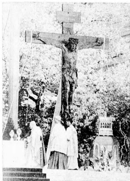
A SZENTATYA A HŐSÖK TERÉN

Augusztus 17-én találkozott a tudomány és művészet képviselőivel a Magyar Tudományos Akadémia várbeli épületében.