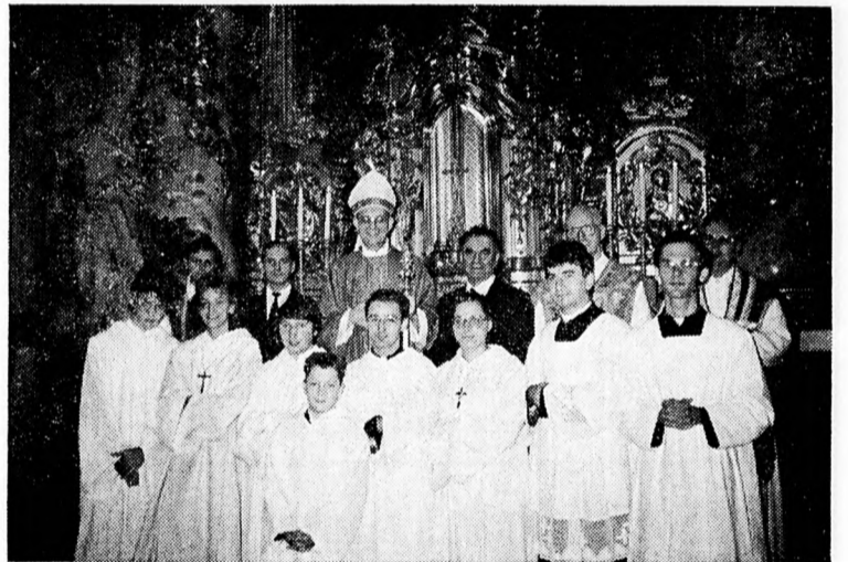
MAGYAR SZENTMISÉN A MÜNCHENI DAMENSTIFT TEMLOMBAN

Augusztusban újból Európába érkezett, hogy Innsbruckban az európai magyar papoknak tartson lelkigyakorlatot. A Szentatya látogatása természetesen őt is Magyarországra szólította, és méltóképpen képviselte a rábízott, öt világ-részben szétszórt katolikus magyarságot.