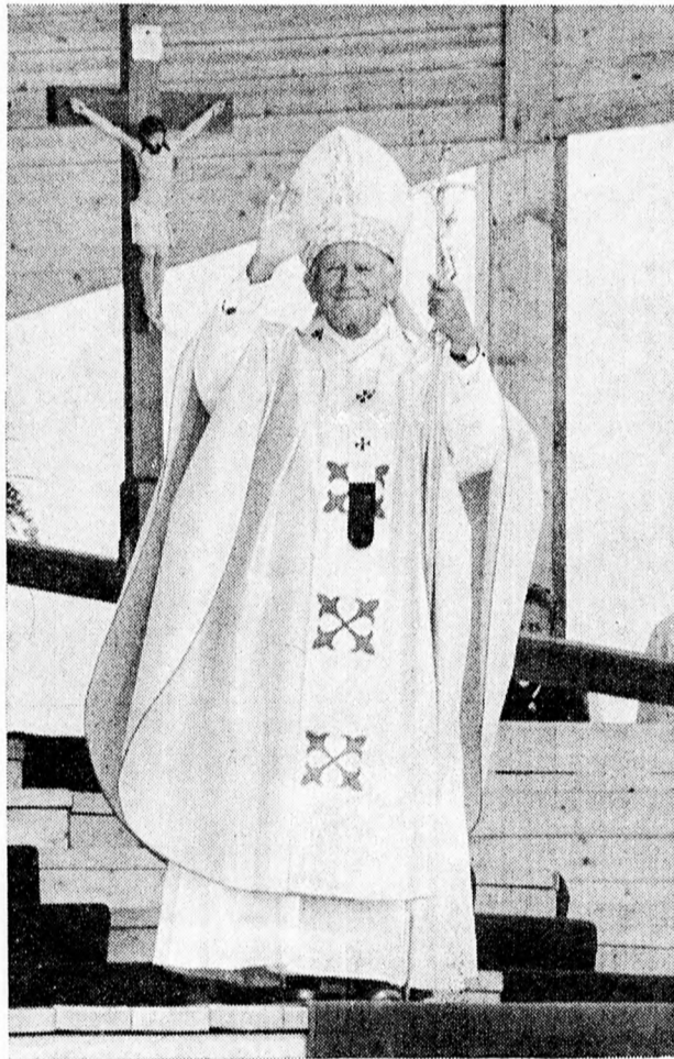
II. JÁNOS PÁL PÁPA PÉCSETT

bátorság és merészség kiegészítésre szorul; szükség van tanulékonyagra és engedelmességre is az egyház, az élet tanítója iránt” — hangoztatta a pápa Budapesten a Hősök terén és a vallásos élet gyakorlására buzdított: „De hogy ne kerüljünk a hűség útjáról, hozzájárul ehhez a mindennapi imádság és a vasárnap megszentelése, a szentségekhez járulás és mindenek előtt a szentmisen való részvétel, amikor az eukarisz-