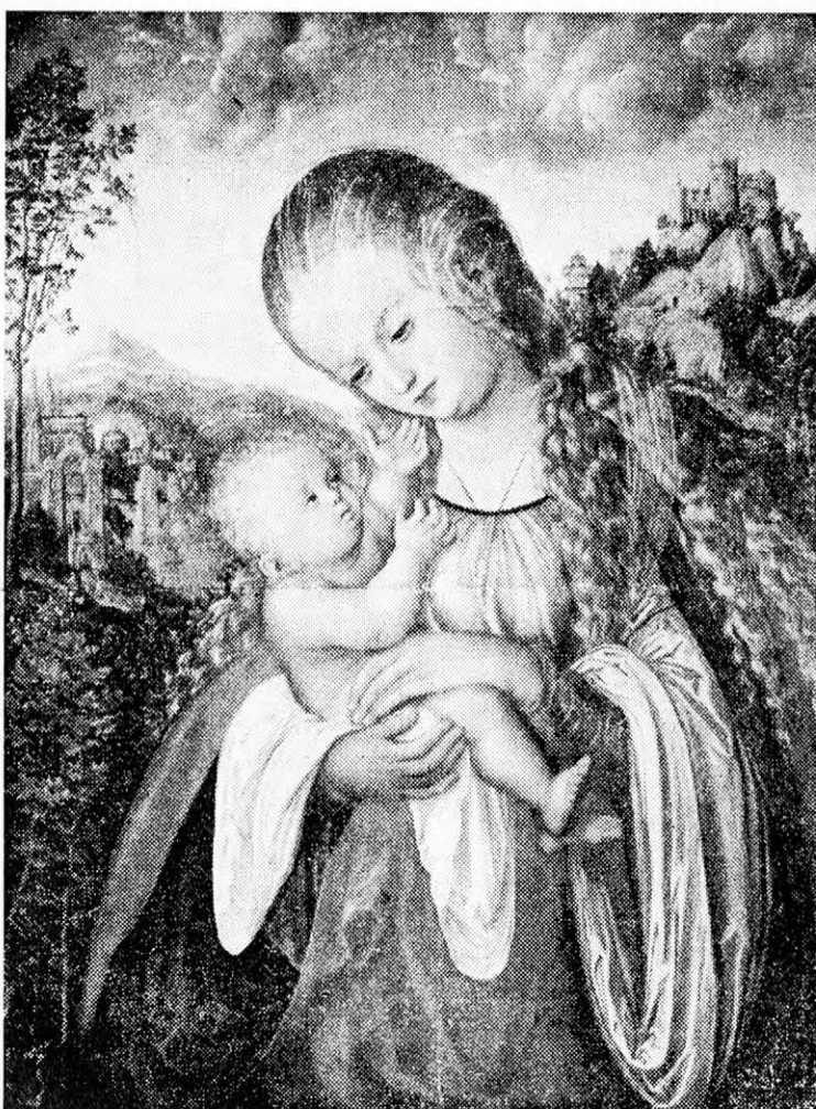
MÁRIA A GYERMEKEL

Lucas Cranach d. Ä. festménye (1518 körül). Karlsruhe, Gemäldegalerie