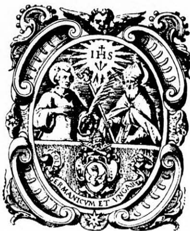
Az 1578-ban egyesített „Collegium Germanicum et Hungaricum” címere.

A 16. századi törökhódoltság a pálos rend számára is sok megpróbáltatást jelentett, így alig száz évi birtoklás után fel kellett adniuk a Santo Stefano Rotondót és ekkor lett a magyar jezsuitáké, illetve az ő vezetésük alatt álló magyar papi nevelőintézeté: a Collegium Hungaricum-é. A templom-adormányozást, minden környező ingatlannal együtt, XIII. Gergely pápa hagyta jóvá 1579-ben. Nem sokáig volt egyetlen tulajdonosa a magyar papnevelő intézet: alig egy évvel az adomány birtokbavétele után ugyanis egyesült a magyar és a német hasonló célú intézmény, hogy mind a mai napig mint Collegium Germanicum - Hungaricum működjék Rómában.