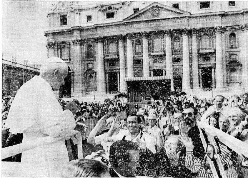
II. János Pál pápa a magyar zarándokcsoport előtt

evangéliumát, az Agyali Üdvözlés első mondatát magyarázta. Arra szólította fel híveit: buzgó imádsággal mélyítsék el hitüket, a mai evangélium tanítását és Gábrriel arkangyal szavai nyomán Mária példájára tudatosítsák magukban az Istennek való engedelmisség szellemét és Szent István ajánlása nyomán a felajánlottság történelmi küldetését. Gondviselésszerű jelnek mondta a primás, hogy a hazai és külföldi magyar zarándokok