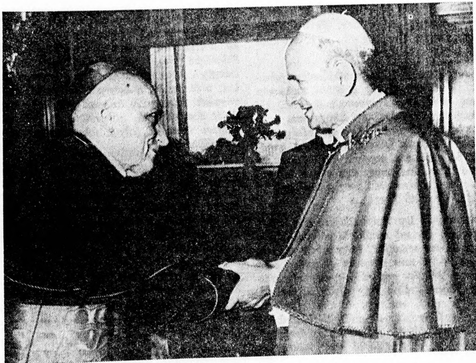
VI. Pál pápa fogadja Mindszenty József bíborost a Vatikánban