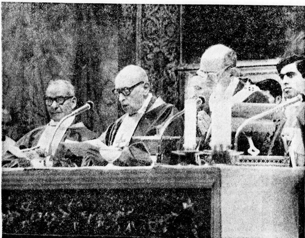
VI. Pál pápa mellett Mindszenty József bíboros a Sixtina kápolnában 1971 szeptember 30-án a koncelebrációs szentmise átváltoztatás utáni imáját végzi.

«... Mindszenty bíboros tanítása, melyet a pápához írt rövid levele tartalmaz, nem azok közül a nézetek közül való, melyek a kritika rögtönző mestereitől naponként kezünkbe kerülnek hóbortos változatossággal... Mindszenty nem ült fel a katedrara... nem volt és nincs igénye arra, hogy hősnak lássék, nem talált ki kicsavart szavakat kompromisszumok kedvéért s még egy kisebb reform vagy korszerűsítés tervével sem jelent meg. Néhány szóban összegezte a keresztény élet, az aláza-