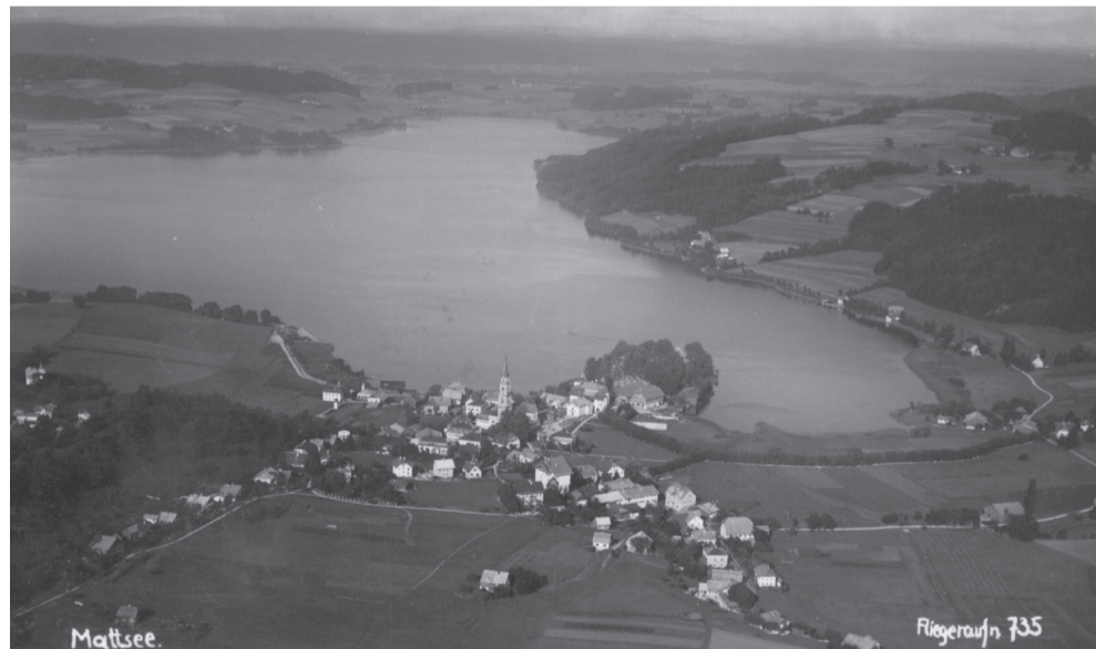
Mattsee az 1930-as években