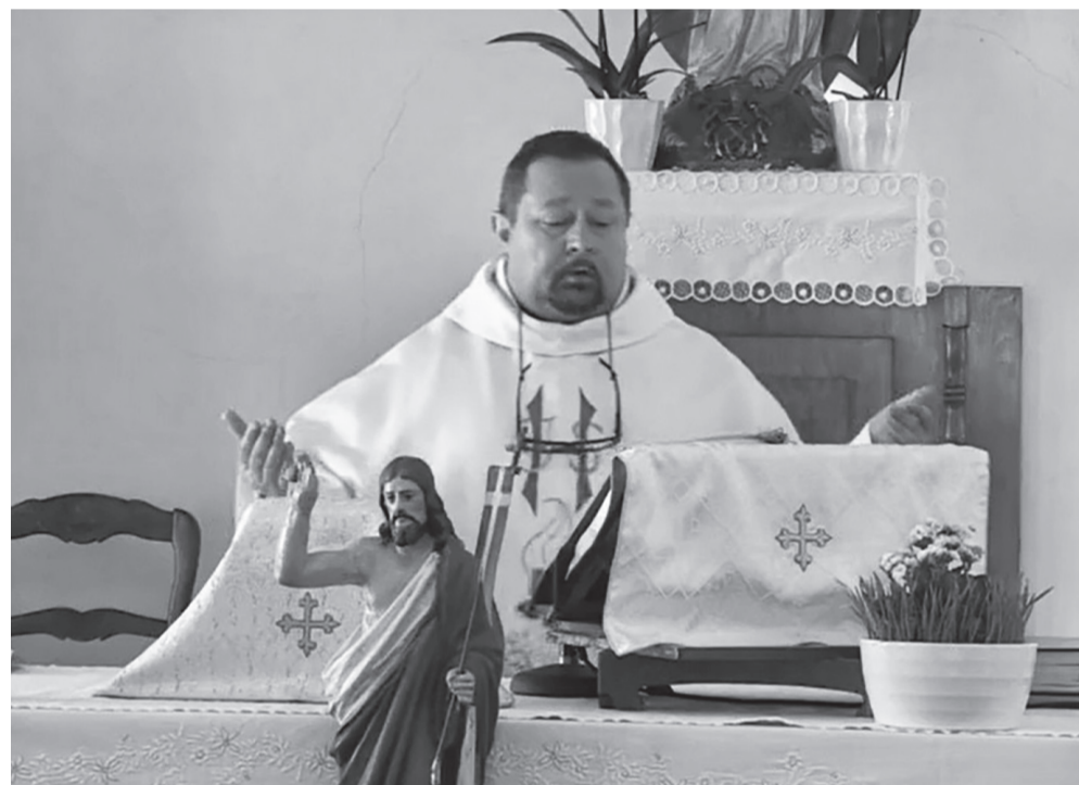
A bázeli és berniek lelkipásztorai a nyáradszeredai templom oltáránál