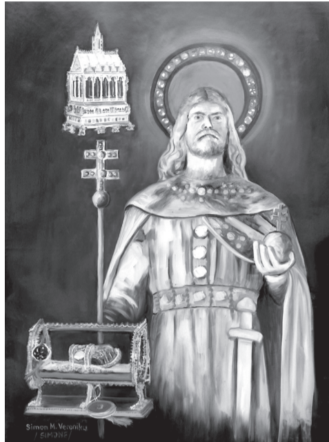
Simon M. Veronika: A Szent Jobb

Egy sziklafal előtt [...] mély gödröt ástunk, beletettük a hordót és betemettük a helyet is, hogy az ásásnak semmi nyoma nem maradt. A sziklafal könnyen felismerhető volt. Környéke lakatlan! Május 2-án mentünk Zellhofba, a misszióházban a priornál jelentkeztünk. Aprior 6-án értesítette az amerikai parancsnokságot