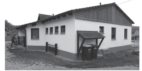
Szépül a bajorországi cserkészpark is

bályok vannak érvényben, amelyek nem teszik lehetővé a táborok megszokott formában történő megszervezését. Am mivel nap mint nap változnak az előírások, a remény hal meg utoljára... Bizakodunk abban, hogy végül mégiscsak fogunk tudni valahol táborozni.