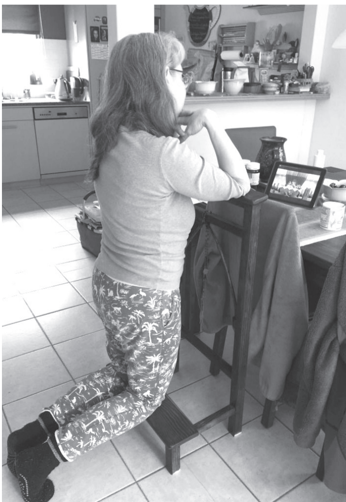
Buzgó részvétel otthon az online szentmisén