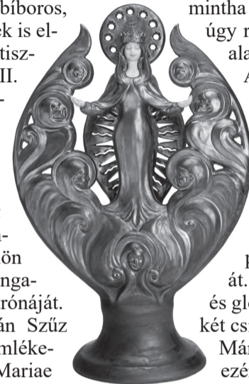
Józsa Judit: Nagyboldogasszony