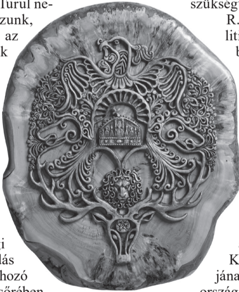
Józsa Judit: Büszkeség