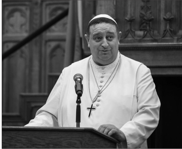
Mária oltalmát tární népünk és a világ elé a legjobb stratégia