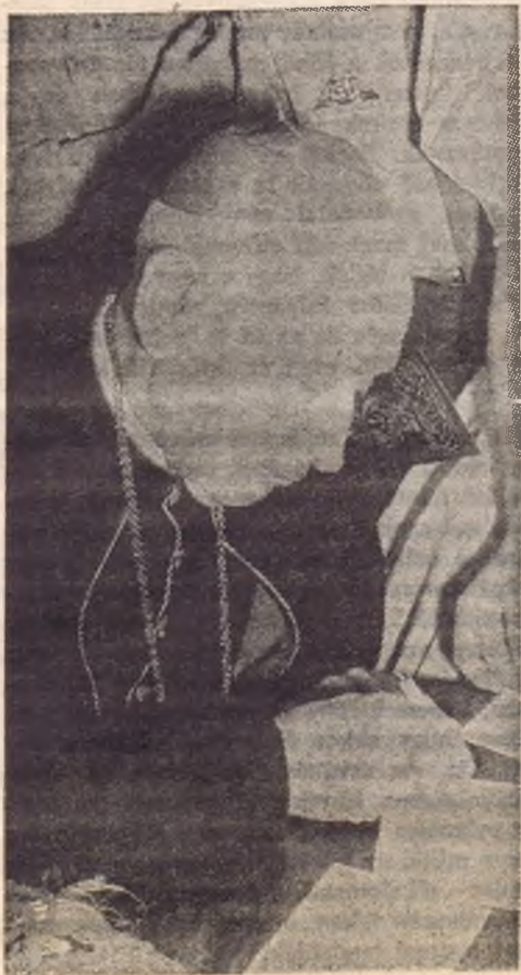
A bíboros aláírja a képeslapokat

Ez a mise egészen az övék: a szerpapi segédletet a bíboros titkárán kívül az európai parancsnok és a Vezetők Lapjának főszerkesztője szolgáltatja, az ó- és újszövetségi szentleckét is egy-egy cserkésztiszt és öregcserkészcserkésza olvassa. A magyar nyelven folyó szertartás alatt a hívők furulyaszóval kísért karácsonyi énekeket énekelnek. A primás mindenkit maga részesít a szentáldozásban.