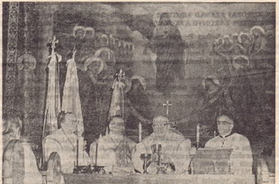
Szentmise a Pázmáneum kápolnájában

ajtón belép Mindszenty József. A cserkészek «Dicsértessék a Jézus Krisztus»-sal köszönik. Ő helyet foglal négy lelkész, így az európai parancsnok és Amerikából a Vezetők Lapjának főszerkesztője között. A főcserkész mond üdvözlő bevezetést, tömören, méltóságteljesen. Kezdődik a kis karácsonyi műsor a primás tiszteletére. «Betlehem kis falucskában, Karácsonykor éjfél tájban Fiúisten ember lett...», — hangzik a vitnyédi bölcsőcs-