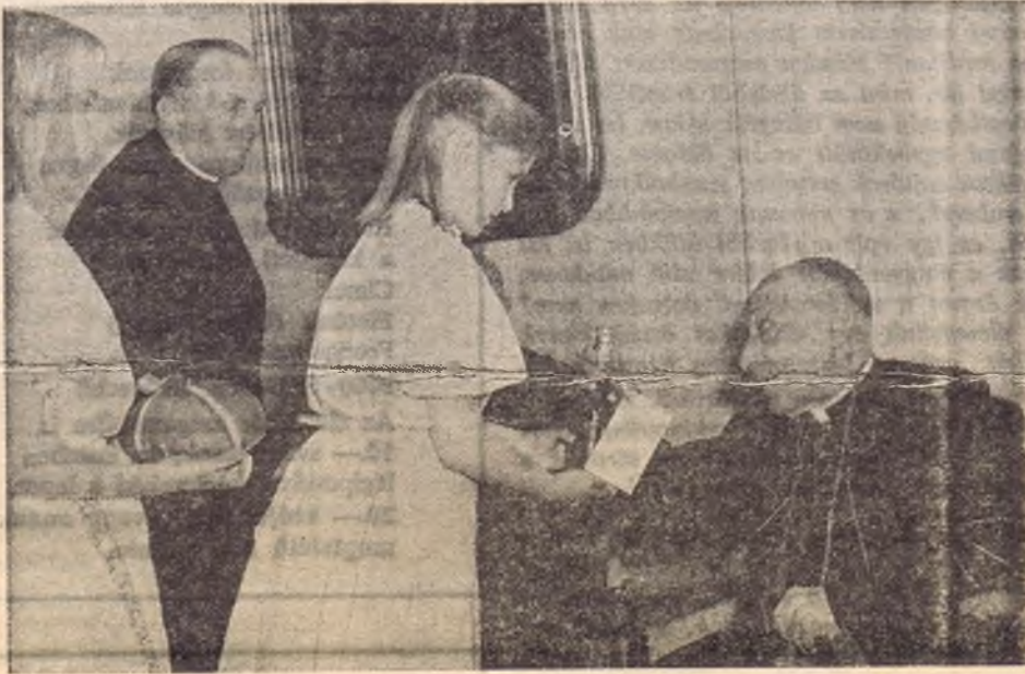
Mindszenty bíborosnak kenyeret és bort ajánlanak fel a cserkészlányok

Másnap, vasárnap reggel kilenc óra. A Pazmaneum kápolnájában Mindszenty bíboros misét mond a müncheni cserkészeknek.