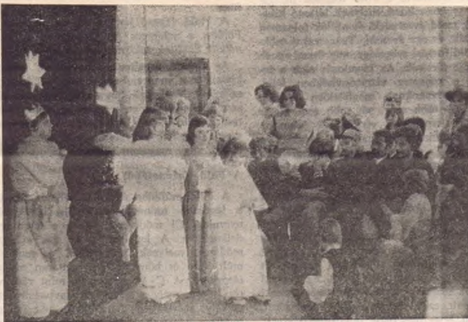
A kölni cserkészcsoportok karácsonyi pásztorjátékának egyik jelenete

A búcsúzás szomorú pillanataiban szeretettel szorították meg a fiatalok egymás kezét: vizontlátásra a nyári táborban!