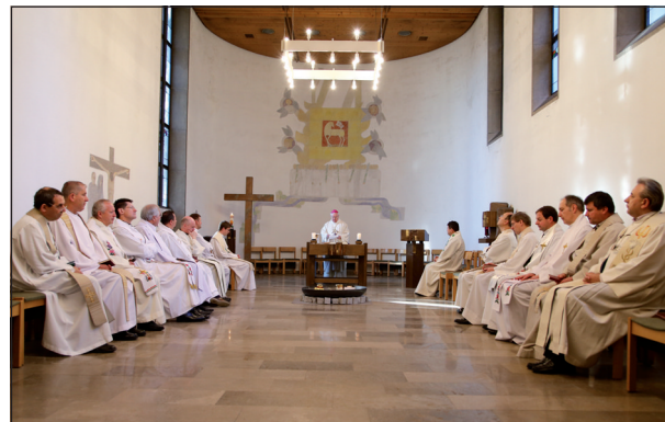
A záró szentmise a wernaui kápolnában

készek több olyan javaslatot is tettek, amely növelheti az újság iránti érdeklődést.