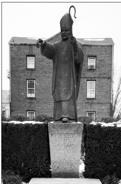
A New Brunswick-i szobor