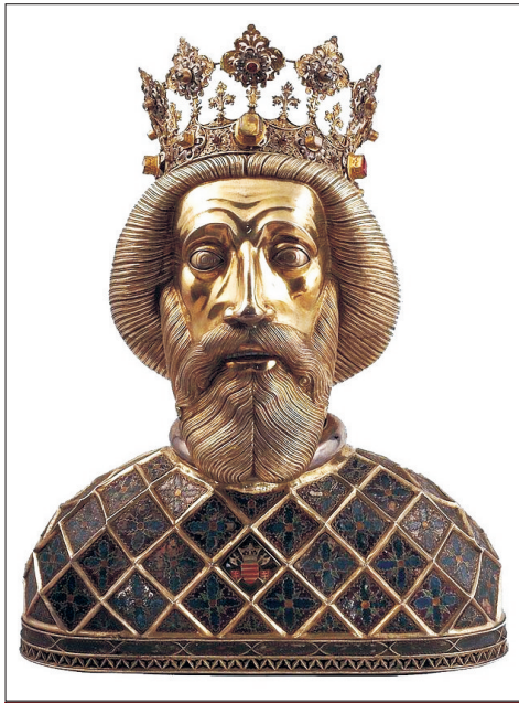
Szent László király Ünnepe: június 27.

Az isteni gondviselés különös intézkedését kell látnunk abban, hogy őt adta a magyar nemzetnek az első szent király halálát követő négy évtizedes vizsály után. Kiváló uralkodói képességével, vitézségével és életszentségével kivezette a magyarságot a belső veszedelmek örvényéből, és megmentette a külső ellenségek pusztulást hozó támadásaitól.