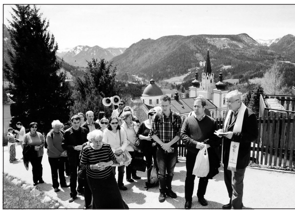
A dunakeszi és a kecskeméti csoport

Több mint ötszázan vettek részt azon a zarándoklaton, amelyet a Keresztény Értelmiségiek Szövetsége rendezett társszervezeteivel április utolsó hétvégéjén Mariazellben. Az ünnepi szentmisére a Kárpát-medence több pontjáról érkeztek zarándokok. Külön busz érkezett Kassáról, a Szent Gellért Pasztorációs és Oktatóközpontból, Vajdaságból, a Keresztény Értelmiségi Kör szervezeteitől, valamint több helyi KÉSZ csoportból.