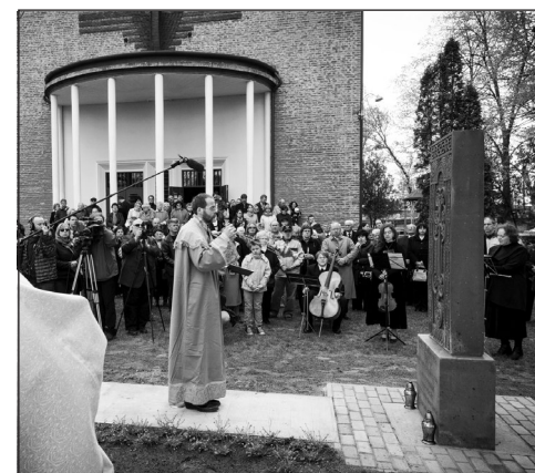
Debrecenben is emlékeztek a népiirtásra

Április 24-én világszerte több millió ember, köztük állam- és kormányfők emlékeztek az örmény népiirtás áldozataira. Az örményországi hivatalos megemlékezéseken több külföldi vezető, köztük Vlagyimir Putyin orosz elnök és François Hollande francia államfő is részt vett.