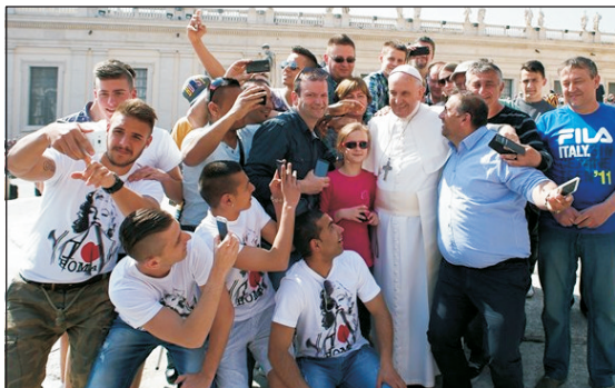
Közös fotó a pápával a Szent Péter téren