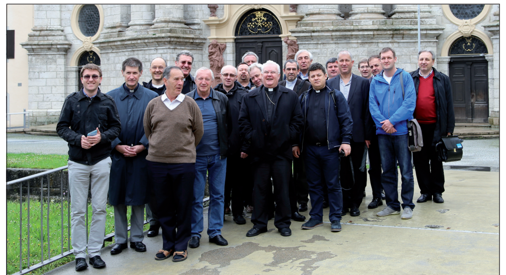
Magyar lelképásztorok a zwiefalteni bencés apátság temploma előtt