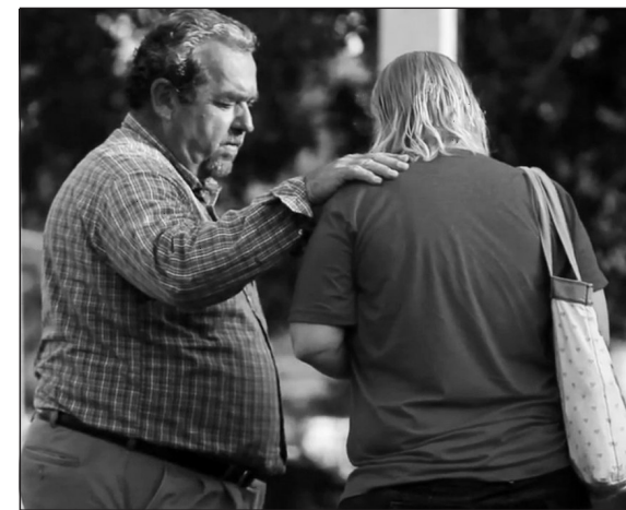
„Anyuka, véd a gyermeked!”

„Ne hibáztassátok magokat. Itt vagyok, hogy segítsék. Mindent megadok, amire szükségetek van. Vittem lányokat egy tenessei anyaoththonba, szóval, ha a