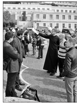
S. Giovanni Rotondóban

Május 1. és 3. között a római Pápai Magyar Intézet papjai San Giovanni Rotondóba, Szent Pio atya sírjához zarándokoltak. A jelenkori Itália nagy