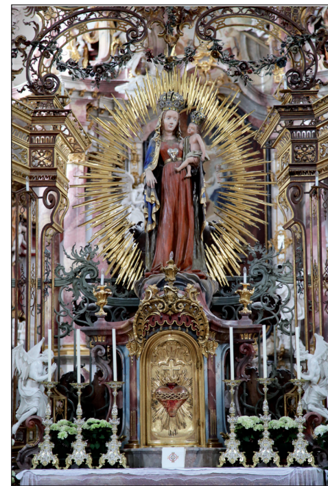
A zwiefalteni Szűzanya-szobor