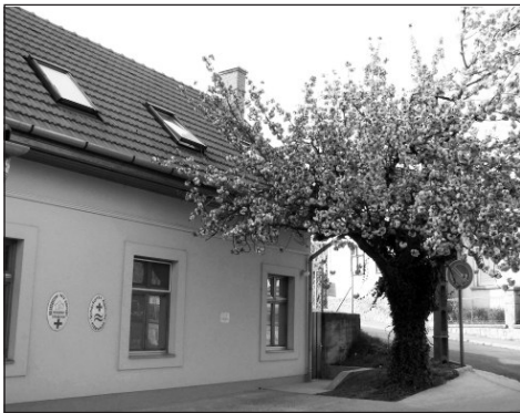
A kismarosi ciszterci rendelő

Gyerekkorom kedvenc itala volt a finom málnaszörp. Jobb fajta cukrászdában vagy vendéglőben választani lehetett kis szörp és nagy szörp között. A málnaszörpöt egy stamperlibe öntötték, ezt pedig belekeverték a pohár szódavizbe. Ha jól emlékszem, a nagyszörpbe kétszer annyi szirup került és a szóda is egy decivel több volt. Néhány évvel ezelőtt, egy dél-tiroli falucskában járva, az élelmiszerboltban házi készítésű málnaszörpöt bukkantam. Megvettem, s