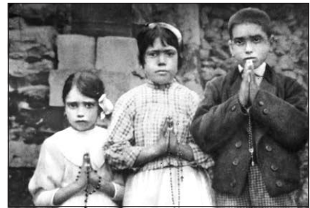
A fenyegetés sem törte meg őket