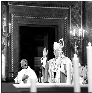
Erdő Péter bíboros primás a budapesti Szent István-bazilikában

ságos, erkölcsös rendjének egyik sarkkövéként az emberi jogok tiszteletben tartása jelenik meg. Az állam feladata, hogy a területén élő emberek alapvető jogait biztosítsa. A Pacem in terris kezdetű enciklika az alapvető jogokat tartalmazó felsorolásában a közösség alkotásához való jogot is hangsúlyozza. Az enciklika nagy jelentőséget tulajdo-