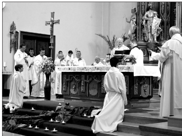
A szerzetesközösségek szétszórásának hatvanadik évfordulója alkalmából tartott szentmise a budai ciszterci Szent Imre-templomban