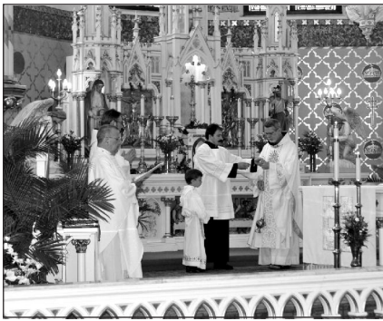
Az elmúlt 105 év kegyelmeiért adtak hátát az ünnepi szentmise keretében

1974. május 23-án Mindszenty József bíboros történelmi látogatásán közel há-