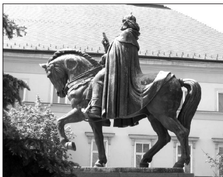
Szent István király szobra Székesfehérváron

Annai nép eltűnt a népek nagy közösségében, akik ide jöttek előttünk vagy utánunk. Annai sok százados harcot, legigazást, kivézetést, fizikai és szellemi elnyomatást egyetlen nép sem bírt ki, mint a magyar. Mindezt kizárólag annak tulajdoníthatjuk, amit István élete utolsó gesztusával tett, annak, hogy országot és népet, hazát és nemzetet Mária oltalma alá helyezte. Nincs más racionális magyarázata annak, hogy vagyunk, hogy itt