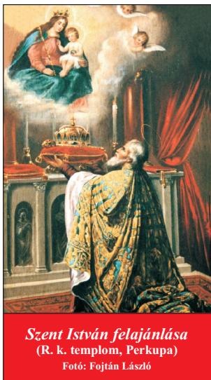
Szent István felajánlása (R. k. templom, Perkupa)

Aki Istennek szenteltként a média területén dolgozik, annak az a feladata, hogy egyengesse az utat új találkozásokhoz úgy, hogy mindig biztosítva az emberi kapcsolat minőségét, a személyes és valódi lelki szükségletei iránti figyelmet; megmutatva az élő embereknek azokat a jeleket, melyek szükségesek az Úr felismeréséhez; (Folytatás a 7. oldalon)