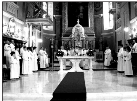
A boldogok közt szeretnénk – hangzott a szentmisén