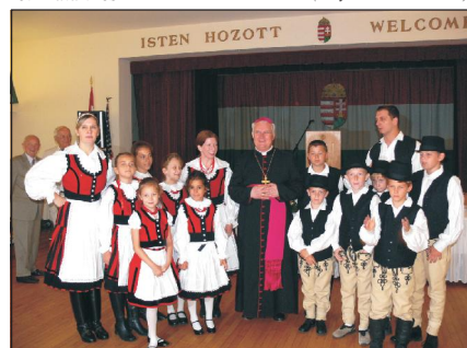
Bérmálási ünnepségen Chicagóban