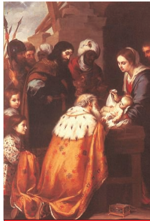
Bartolomé Esteban Murillo (1617–1682): A bölcsék hódolata

Ha egyszerű kézelebről szemügyre vesszük a kényszerűségből kivándorlók, a száműzöttek, a menekültek és az emberkereskedelemből áldozatainak táborát, akkor sajnos sok gyereket és fiatalokot találunk abban. Ezért lehetetlen hallgatnunk a menekülteknek és száműzötteknek a világ különböző részein található nagy táborának drámai képe láttán. Hogyan gondolkodnánk ezekre a kis emberi lényekre, akik a boldogság ugyanazon legítim elvárásaiért jöttek a világra, mint mi, valamennyien? Egyben hogyan gondolkodnánk arra is, hogy a gyermekkor és a fiatalok a férfi és a nő fejlődésében olyan alapvető jelentőségű időszak, amely stabilitást, nyugalmat és biztonságot követel? Ezeknek a gyermekeknek és fiataloknak a „láger” jelenti az egyetlen élettapasztalatot, az a láger, ahol kényszerből kell tartózkodniuk, elkülönítve, lakott területen (Folytatás a 7. oldalon)