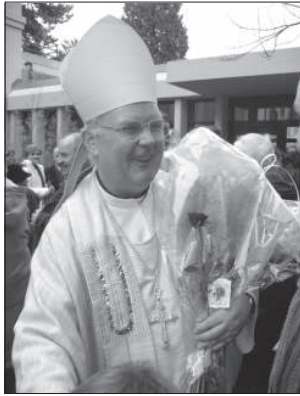
Cserháti Ferenc püspök bázeli magyarok között

dőszentje is Árpád-házi Szent Erzsébet. Prédikációjában a szentek körében páratlan népszerűségnek és ünneplésnek örvendő Szent Erzsébetnek méltóságát rövid életéből vett számos anekdotán keresztül világította meg. Megemlítette, hogy a Szent Erzsébet-évet Bernben 2006. novemberben nyitotta meg és most Bazelban 2007 novemberében zárta le. A szentmisén kántorunk orgonájátéka, Szent Erzsébet- és Krisztus Király-énekek mellett a misszió művészeinek fuvola- és orgonájátéka, valamint éneke gazdagította. A közel kétórás ünnepi szentmise végén a püspök rózsákat szentelték, amit a mise befejeztével kiosztottak.