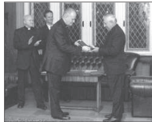
A kitüntetést Erdő Péter bíboros adta át a püspöki kar székházában