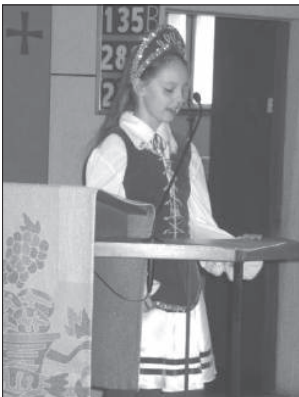
Magyar kislány köszönti a főpásztorokat

A szentmise kezdetén a vezetőség a misszió nevében Cserháti püspök atyát magyarul, Gächter püspök urat pedig németül üdvözölte. Utána Simpf János erdélyi tiszteletű „Főpásztor köszöntése” című versével köszöntötte Cserháti püspök atyát egy 10 éves bázeli magyar iskolás kislány.