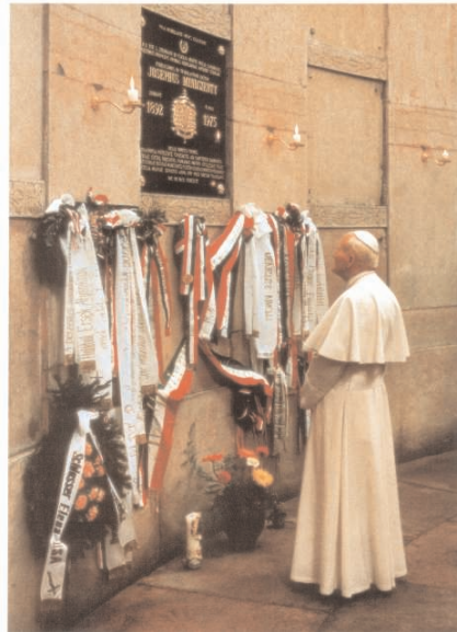
II. János Pál pápa magyarországi látogatása Mindszenty József hercegprímás sírhelyénél, az esztergomi bazilika altemplomában, 1991. augusztus 16-án.

illették, és attól sem riadtak vissza, hogy az általa vezetett liturgiát megzavarják. 1948. december 26-án letartóztatták, börtönbe vetették és kegyetlen vallatási módszerrel kínozták. Durván, még gumi-