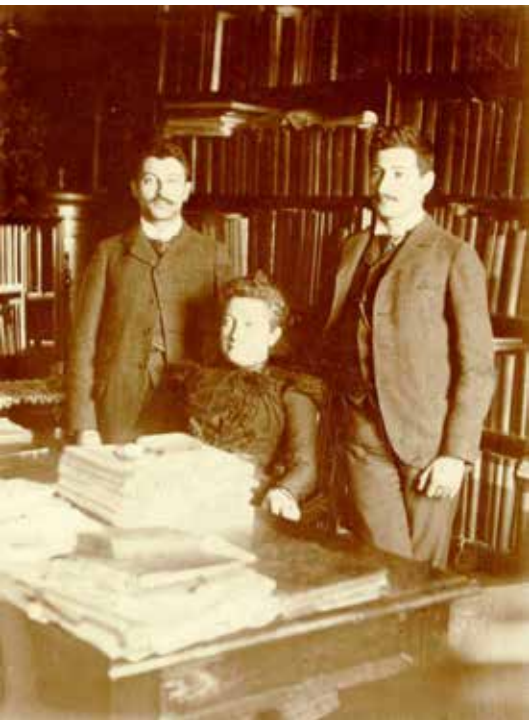
Goldziher felesége és fiai a tudós dolgozószobájában

Egy évvel később a fehérvári zsidó iskola felvette Goldziher nevét, és példakép gyanánt minden osztályterembe kifüggesztették a képét is. De nemcsak a zsidó iskolába került a tudós arcképe, hanem a cisztercita gimnázium dísztermébe és a Fehérvári Kereskedelmi Csarnokba is. 18