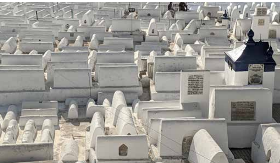
Temető Fezben (Marokkó)

A további évszázadokban a marokkói zsidók történelme ugyanolyan fordulatossá vált, mint korábban: az éppen hatalomra kerülő arab vagy berber dinasztia kegyeinek kitéve hol kedveltek, hol jogfosztottak voltak. Akármi történt is azonban, a marokkói zsidók között mindig akadtak kiemelkedő tóratudósok, általában a kabala nagy ismerői és szent életű férfiak. Megemlítjük még közülük Cháim ibn Átár rabbit, aki a XVIII. század első felében élt, vagyis a Báál Sém Tov kortársa volt. Számos híres mű szerzője volt, aki aranyművességgel kereste a kenyerét, és egy híres történet szerint nem-zsidó munkáltatója beárulta egyszer a szultánnál, aki élve dobatta őt az oroszánjai elé. A rabbi, táleszával, tfilinjével és szent könyveivel felszerelve ment a vadállatok közé, akik három napon át csak köröztek körülötte, de nem bántották a folyamatosan szent szövegeket kántáló rabbit. Ezt látva a szultán megkegyelmezett neki, és barátjává fogadta őt.