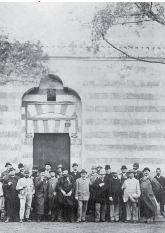
Goldziher egyiptomi úton

egyetem próbálta megnyerni tanárának a hitközségi titkárt, de ő nem akart külföldre menni. 1894-ben a budapesti egyetem címzetes tanárrá nevezte ki, azaz végre rendes tanár lett, de fizetést nem kapott. Végül aztán, 30 évi titkári munka után, 1905-ben a király a sémi filológia és az iszlám történetének nyilvános rendes tanárává nevezte ki Goldziher 10 így ő végre nem kényszerült többé adminisztrációs munkára, hogy családját eltarthassa, hanem tudásából profitálhatott. Goldzihernek pedig a mintegy száz nemzetközi pozíciója és rangja közül minden bizonnyal a legkedvesebb az volt, amikor 1917-ben a bölcsészkar dékánjának nevezték ki.