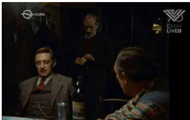
Részlet Az ötödik pecsét című filmből

A megemlékezéssorozat 6-7 órás blokkokra osztva megtekinthető a zsido.com archívumában.