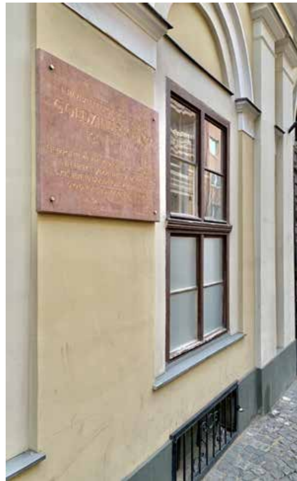
Holló utca

„Jelentősége túlemlelkedik Magyarország határain. Nemcsak a keleti nyelveknek és vallásoknak volt kiváló bűvára, hanem a nemzeti