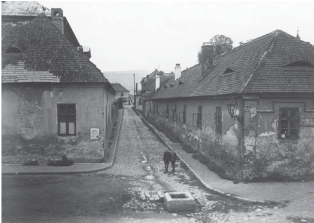
Feltételezett mikve Óbudán (balra), mögötte a zsinagóga épülete

a Kiscelli Múzeum gyűjteményéből származó fotón látható, épp a mikvéje lehetett.