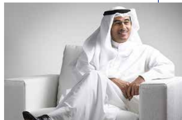
Mohammed Ali-Alabbar

Később azt is bejelentették, hogy 2022-ben megnyitják az Egyesült Arab Emírségek második zsinagógáját egy ökumenikus központ részeként, melyben mecset és keresztény templom is helyet kap. A három nagy épületből és egy köztük elterülő parkból álló létesítmény az Ábrahámita Család Há-