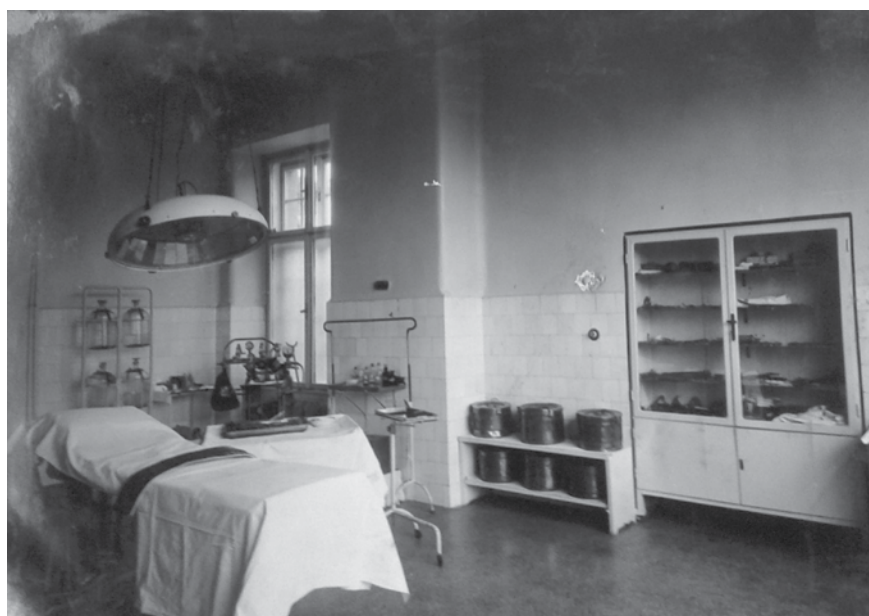
A Szeretetház egyik műtőterme

„40–50 lakást kívánna benne elhelyezni. Negyvenet kétszemélyesre, tízet egyeseknek. A két személynek való lakások két tágas szobából, előszobából, melyben konyha és éléskamra is volna, állnának. Az egy személyre való szobák egy ablakosak lennének s kettő-kettőnek volna egy-egy előszobája. Az épület föl