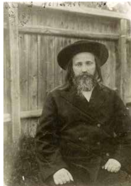
Teitelbaum Joel rabbi

gek igyekeznek levetni magukról a nevüket, hogy innentől kezdve ők is ortodoxnak legyenek nevezve” – írta erről a jelenségről Teitelbaum Joel szatmári rabbi 1930-ban 5 .