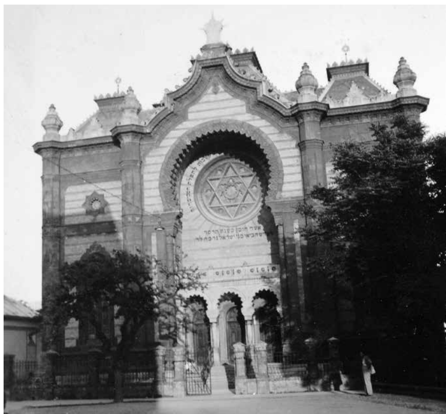
Zsinagóga Ungváron

Kérdésselvetésében többek között Eisenstadt Méir (1670–1744) kismartoni (ma Eisenstadt, Ausztria) rabbi írására hivatkozik 19 , amiben Buda megnevezése kapcsán az szerepel, hogy „annak ellenére, hogy mindig Budnának írtuk, de mivel a zsidók és a nemzsidók egyaránt Ofennek nevezték miután a németek odaköltöztek, ezért elsőként be kell írni az Ofent és aztán a Budnt.”