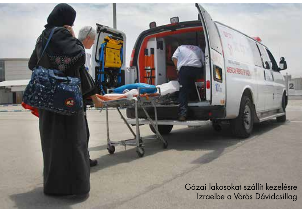
Gázai lakosokat szállít kezelésre Izraelbe a Vörös Dávidcsillag