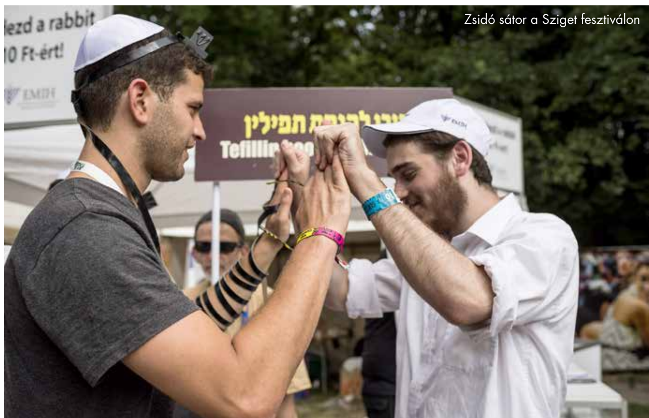
Zsidó sátor a Sziget fesztiválon

Igazából ez a kérdés: ahogy a salzburgi fesztivál nem képzelhető el Mozart nélkül, a zsidó fesztiválok nem a zsidó tartalom tenné egyedivé és különlegessé?