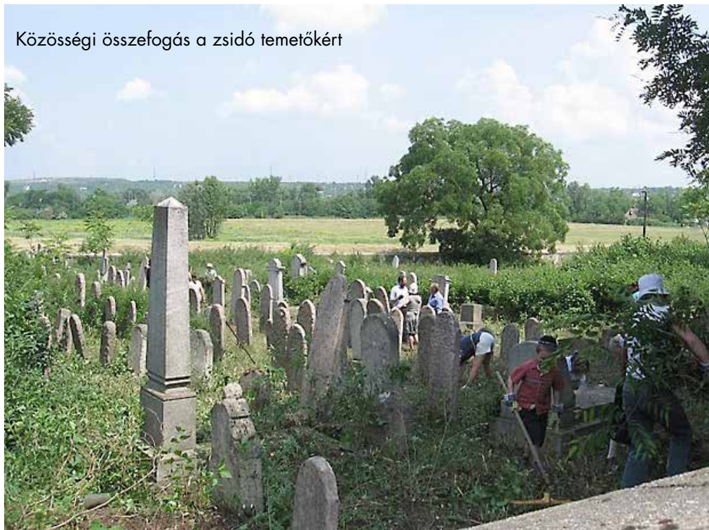
Közösségi összefogás a zsidó temetőkért

Annál a hatszázötven temetőnél, amelynél szerződést kötött a MAZSIHISZ és az önkormányzat, elmondható, hogy létezik karbantartás, amely persze örök kritika tárgya lehet, ugyanis a gondozottság szintjének megítélése azért erősen szubjektív dolog. Általában akkor sikerül létrehozni egy ilyen együttműködést, ha valaki személyesen kötődik az adott temetőhöz, vagy az adott település évforduló előtt áll. Jó példa Bakonytamási, ahol az önkormányzatnak volt egy kis pályázati pénze a kerítés felújításához. Ott sikerült is találnia Winkler Miksának pár olyan családot, akik kötődtek a temetőhöz, és még a hitközség is be tudott szállni a munkálatokba. Ennek a végeredménye pedig most egy nagyon szépen felújított, rendben lévő temető. „De az 1600 temetőhöz képest ez nyilván elenyésző” – fogalmazott a Mazsihisz képviselője. Hozzátette: nagyon ésszerű, jól átlátható programra van szükség. Arra a kérdésünkre, miszerint mikor lesz látható eredménye a programnak, Winkler Miksa azt mondta, hogy egyelőre ezt nehéz megítélni, de valószínűleg jövőre.