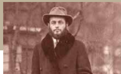
Schneerson rabbi a világháború előtt

A Rebbe számos alkalommal szólt tudomány és hit viszonyáról, különféle mélységekben fejtve ki a témát. Ami a kettő közti látszólagos feszültséget illeti, a Rebbe nem kedvelte az „apologetikus” megközelítést, mely a szentírás szakaszokat és a hit tételeit a kor tudományos keretelméleteihez igazodva kísérli meg újraértelmezni. „Volt idő – írja a Rebbe egyik levelében –, amikor a tudósok úgy vélték, van olyan »tény«, amit tudományos módszerekkel »igazolni« lehet. Ma viszont inkább az az általános vélemény, hogy a tudományos módszer nem »igazol« tényeket, hanem több-kevesebb valószínűséget rendel egyes hipotézisekhez. A hívő zsidónak, aki olyan dokumentumot tart a kezében, melyről tudja, hogy a világ Teremtőjének kinyilatkoztatott szavát tartalmazza, s a mondott Teremtő törvényeit, semmi oka rá, sőt, semmi tudományos