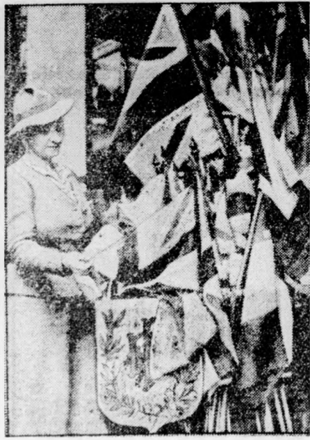
Páris készülődik az angol királyi pár látogatására: az üzletek tele vannak angol zászlókkal