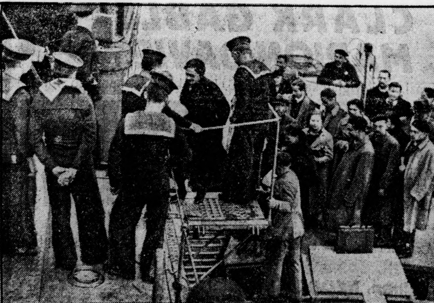
Egy angol hadihajó fedélzetére veszi azokat a spanyolokat, akik a kormánycsapatok elől menekültek el