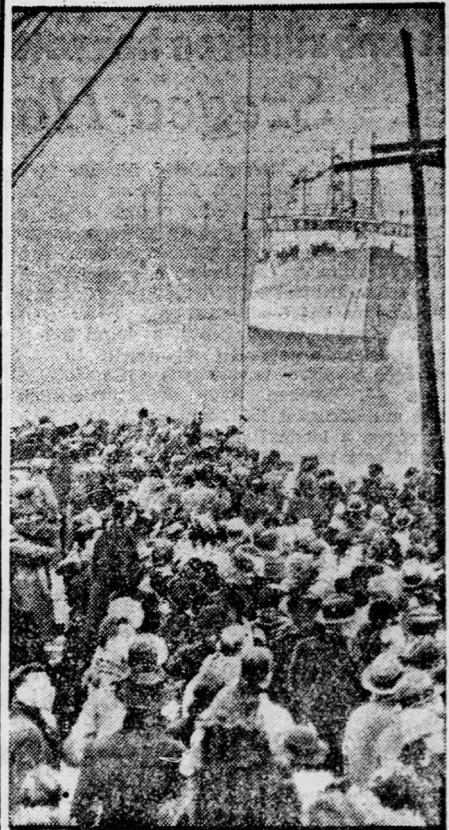
Az angliai Southamptonban most bocsájtották vízre az eddig épült legnagyobb yachtot, amely az Amerika-Anglia között évenként ismétlődő yachtversenyen fog résztvenni

A dán királyi pár Párisba érkezett. Párisból jelentik: Keresztély dán király és a királyné Kopenhágából Párisba érkezett. A dán uralkodópár innen folytatja útját a ivRierára.