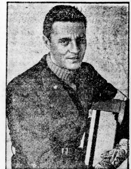
Schafer Károly, a többszörös mlkorcsolyázó olimpiai és világbaajnok professzionista lett és először Angliában fog bemutatkozni március folyamán