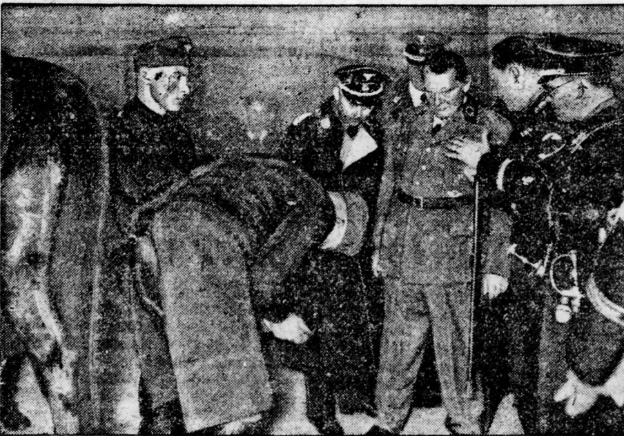
„ZÖLD HÉT” NEMETORSZAGBAN A német parasztek „Zöld hete” most nyitott meg Berlinben. Egy falusi kovács Göring miniszterelnök előtt mutatja be tudását.