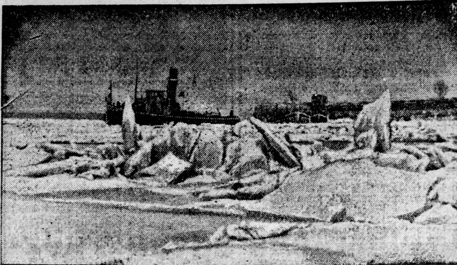
DUNAI HAJÓ KÜZDELME A JÉGGEL A Duna alsó folyásánál a jégzajlás hatalmas arányokat öltött. Néhány, a jég közé rekedt hajó csak nagy küzdelmek árán tud magának utat törni.