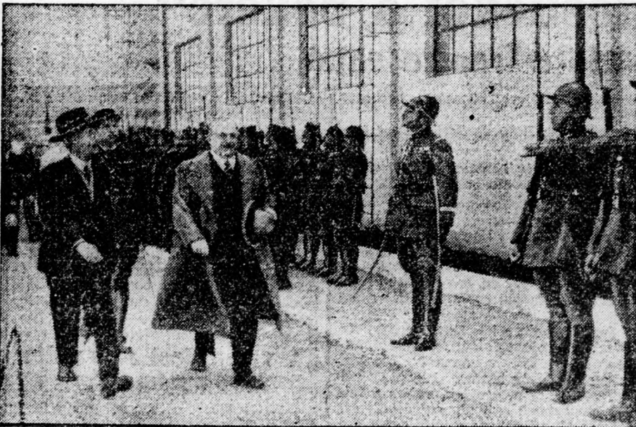
DIPLOMATA-LATOGATÁS A TAVOL KELETEN Sir Arthur Wanchope, Palesztina angol kormányzója és De Martel gróf, Sziria és Libanon francia kormányzója, elvonulnak a libanoni francia csapatok arcóle előtt