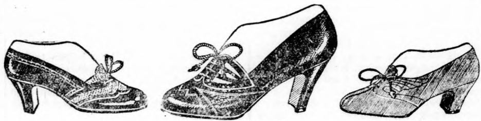
Fekete és barna divatcipő Divatcipő, barna vagy fekete bőrből Zöld, barna és fekete divatcipő