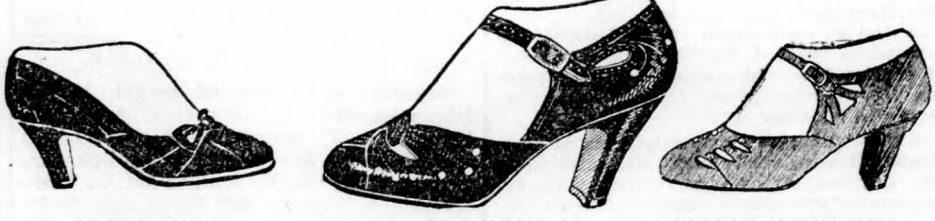
Bőr divatcipő, fekete és barna színben Barna divat bőrcipő Zöld és kék divatcipő