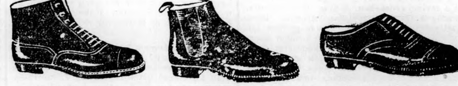
Férfi magasszárú cipő, fekete vagy barna színben Férfi cügoscipő Férfi félcipő, fekete és barna színben

Vidékre utánvét mellett szállítunk, meg nem felelőért a pénzt visszaadjuk.