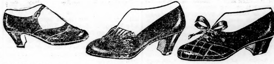
Divatcipő, fekete és barna bőr, vagy fekete lakk Fekete bőr- és lakkcipő Zöld és kék, vagy fekete és barna bőrből