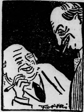
STUX ÉS FUX az IBUSZ-nál a 6. oldalon