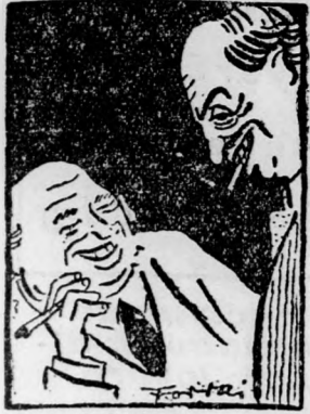
STUX ÉS FUX BESZÉLGETÉSE a 8. oldalon