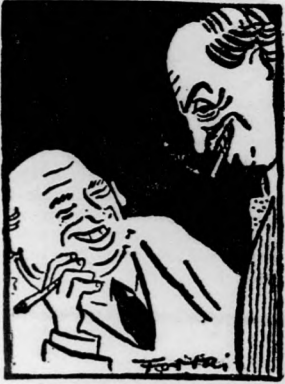
BESZÉLGETÉSE A ZÁLOGHÁZBAN a 6. oldalon.