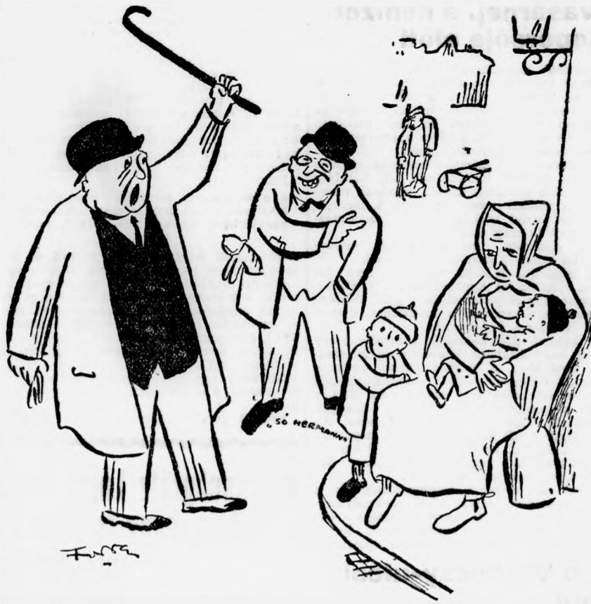
„SÓ HERMANN” (a tejkartel vezéréhez): Látja, igazgató úr? Hát nem hallatlan, hogy rontják ezek a kartelen kívüliek az Ön árait.