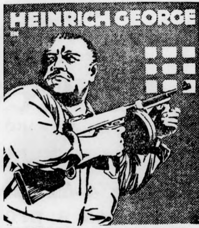
A filmet a cenzúra korlátozás nélkül engedélyezte (Metro—Goldwyn—Mayer-film)