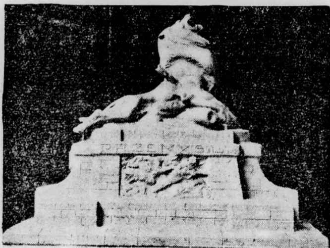
Cser Károly alkotása

Meg vagyunk győződve, hogy a magyar társadalom méltóan elismeri a przemysli hősi halottak érdemeit és áldozatkészségével segítségére siet az Emlékmű Bizottságnak a terv megvalósítása érdekében.