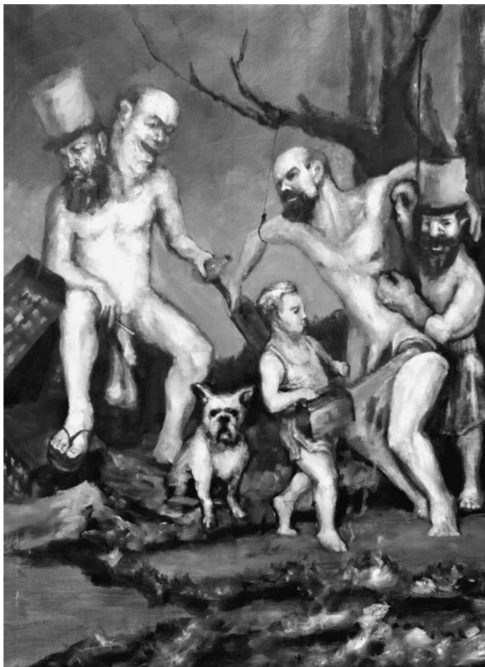
Érintések, 170x140 cm, 2010

– Tegnap újra ott volt – mondta rekedten, és lehajtotta a fejét. Hozzá sem nyúlt a kávéhoz. Nem értettem, ez miért olyan nagy szám, hiszen már eddig is számtalanszor találkozott a biciklissel, volt ideje megszokni. Láttam, milyen ideges. Vártam. Nem folytatta, elgyötörtten hallgatott. Burokként zárult ránk történetének különös atmoszférája, a zajos kávézó, a jövés-menés, a szomszédos asztaloknál egy-