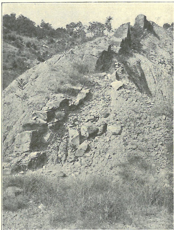
Fig. 1. Die fossilführende Mergelbank bei Drvenik.

witterungsmaterial bedeckt, in welchem im allgemeinen ziemlich gut erhaltene Fossilien zu sammeln sind. Das Gesteinsmaterial ist ein graulich-gelblicher Mergel, dessen Lagerungsverhältnisse jedoch eben wegen der mächtigen Verwitterungsschicht nicht zu ermitteln sind. Demzufolge ist uns weder das Einfallen bekannt, noch wissen wir, ob sich diese Bildung auf petrographischer oder faunistischer Grundlage