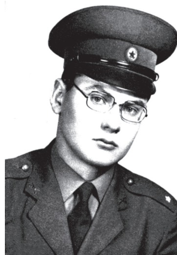
A Magyar Néphadsereg örvezetője (1975)