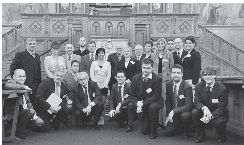
A VERITAS Történetkutató Intézet „csapatával” az Országház Felsőházi termében (2014. szeptember 29.)