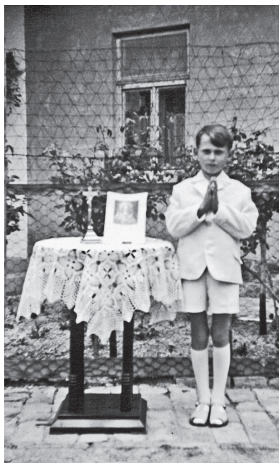
Elsőáldozó (Törökkoppány, 1964)

lott harmincas évekbeli kommunista összeesküvésről, amelybe „külsősként” Rajk László is belekeveredett. Vargyai kérelmét azzal utasították el, hogy beengedésem sértené az egyetemisták esélyegyenlőségét.