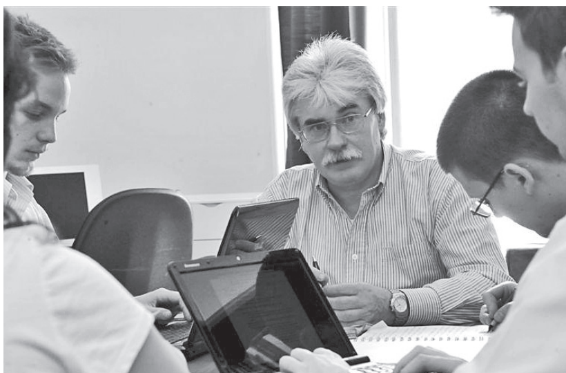
Seminárium a Károli Gáspár Református Egyetemen (2012)

– Nem tudom. Nem tudok mások nevében nyilatkozni, de ha arra gondolok, hogy 1945 után fel kellett építeni egy nemlétező partizán- és egyéb történelmet, akkor bizonyára igen. Egyszer az átkosban – hiába, hogy én a csendőrökkel foglalkoztam – rám testálták, hogy írjam meg Rácz Gyula „partizánvezér” történetét. Az életrajzi könyv, amibe szánták ezt a fejezetet, meghíusult; de a fejezet évek múlva kislakú brosúraként – negyvenkét oldalon! – mégis megjelent a Zrínyi Katonai Kiadónál. Ilyen természetű musz-feladat tehát létezett. A kollégáim mosolyogtak, mert azért, hogy kijöjjön a közel három ív, olyanok is szerepeltek benne, hogy „megcsillan a hold-