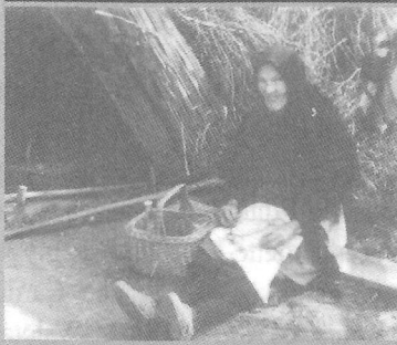
Csúzai anekdoták és életképek