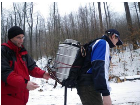
Teahordók a hegyen