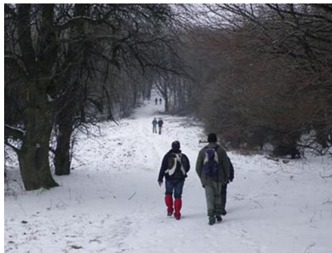
Azért volt hó

Jó döntés volt lemondás helyett megrendezni az emlékversenyt, hiszen negyven fölött volt a résztvevők száma. Nagy örömmünkre, egy négytagú felföldi (Révkomárom-Érsekújvár) magyar társaság is volt közöttük. Hó esetén még nagyobb lett volna a részvétel. Ami viszont kellemes meglepetés volt: péntek késő délután fölmentünk a Csóványos alá, hogy az irányjelző szalagokat kitegyük, és a Foltán-kereszt fölött pár cm sízhető, jó minőségű havat találtunk.