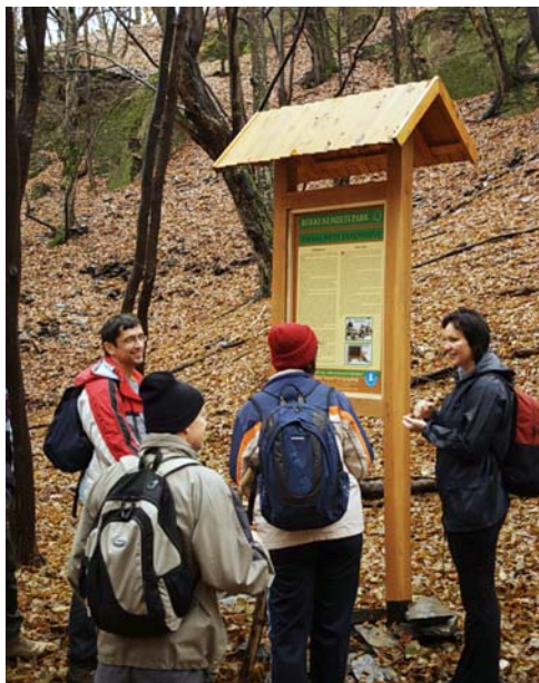
A felhagyott palabánya

„Working Together for Tomorrow’s Future” – Dolgozunk együtt a holnap jövőjéért. Ez a jelmondata a Fife Air Cadets Conservation Group nevű skót szervezetnek, amely az egyik önkéntes munkatáborát hozzánk, a Bükk Nemzeti Parkba szervezte.