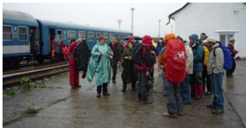
Turistatalálkozó „Újhelen” (13. oldal)