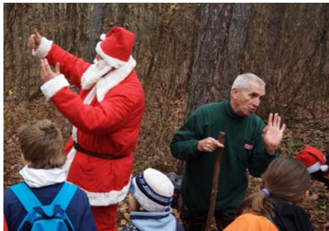
A Bükki Mikulás és segítője (16. oldal)