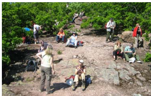
MKE közgyűlés és túraprogram