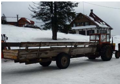
Sítúra a Madarasi Hargitán