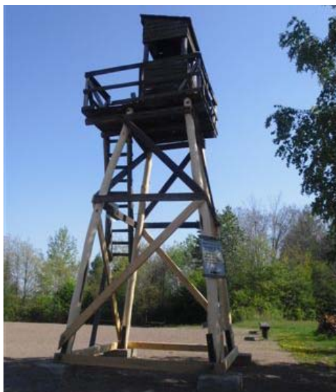
Emlékezés a „magyar gulágra”