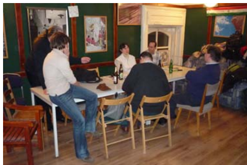
Új helyen az MKE klub