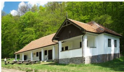
Samassa (Lamboth) ház

A ház mellett állandóan csordogáló Kis-Som forrás karsztvízéből bátran megtölthetjük kulacsunkat, majd a K+ turista jelzést követve indulunk északi irányba. Pár perc alatt elérjük az egnék kedvelt kirándulóhelyét, a Hereg-rétet, innen megcsodálhatjuk a Három-kő és a Tarkó impozáns sziklatömbjeit. Rövid pihenő és fotózás után (a rétet beborító kankalin mezőnek nehéz ellenállni) a Hárs-kút felé vesszük az irányt. A forráshoz érve (mostanság bőven csordog-