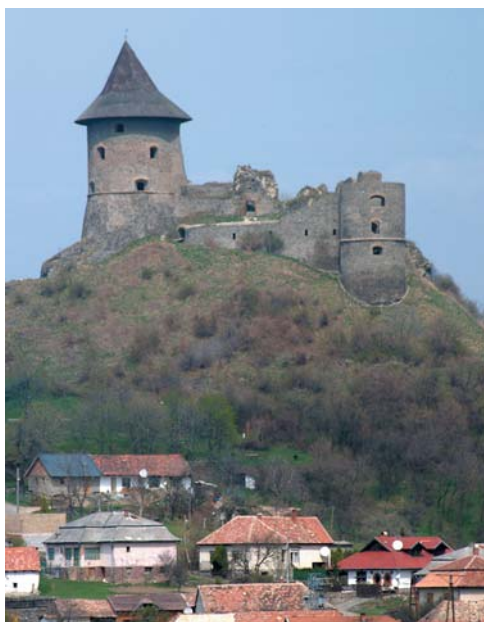
Somoskő falu Magyarországon van, a vára már Szlovákia része

meglehetősen éhes voltam, ezért amit elémtett, elfogyott. Reggel kis csalódás érte szakácsomat, mert a maradék paprikás krumplit odavettem a kóbor kutyáknak, akik szagminta után, kóstoló nélkül továbbálltak.