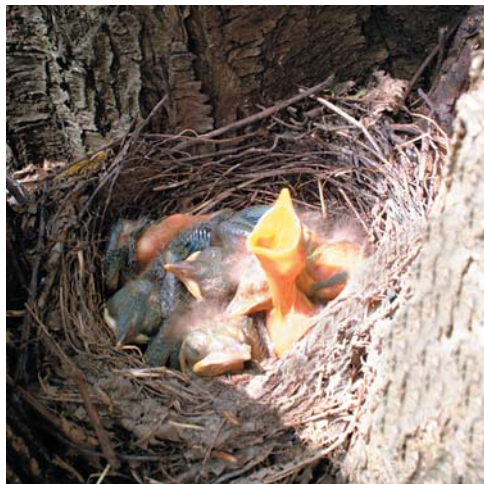
Négy nappal később...

Hogy megmelegszik minden alkonyat és mennyi vágy kel, s mennyi vízió, ha hallom drága, régi hangodat, múltam madara, fekete rigó. ( Fekete rigó, Áprily Lajos )