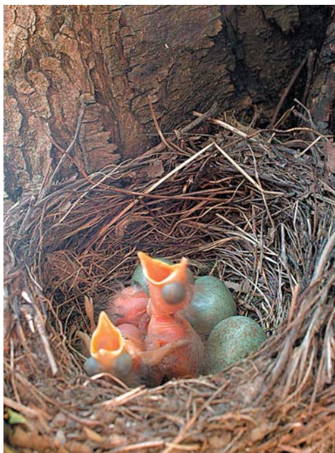
A felvétel időpontja: 2005. május 29.

Schmidt Egon híres madárszakértőnk mondta, a fekete rigó akár Budapest címerállata lehetne. Ha hektárra átszámítanánk, legalább öt-ször annyi fekete rigó él a városban, mint a budai hegyekben vagy az erdőkben. Ráadásul amíg az erdőben évente kétszer, itt háromszor nevelnek fiókát, sokkal korábban kezdenek költetni a melegebb idő miatt.