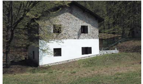
Tamás-kúti ház, a táborozás helyszíne