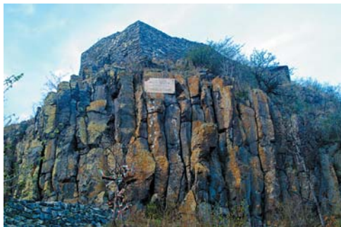
Bazalt sziklára épült Salgó vár. Itt is járt Petőfi Sándor