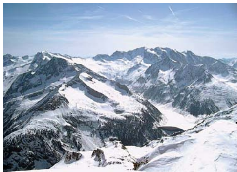
Az Aurine-i Alpok és a Grösser Möseler (3479 m)

Hajnali ötkor indultunk a Neves-i tótól, bizakodóan nézegetve a kristálytisza eget, sziporkázó csillagokat. De örömünk korainak bizonyult, mert ahogy kivilágosodott, szállingózni kezdett a hó. Csak úgy kavargott fejünk felett, ahelyett, hogy lábunk alatt lett volna – szinte egy órát kellett gyalogolnunk, mire végre felvehettük a síléceket. Így jóval könnyebbek lettek a hátizsákok – akkor még nem tudtuk, hogy főlösegesen cipeljük a hágóvasat és a jégcsákányt. Még reménykedtünk, hamarosan eláll a havazás, s mire felérünk a csúcsra, talán még a nap is kisüt. Túlságosan optimisták voltunk.