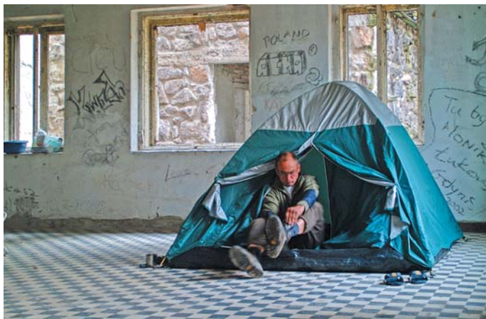
Reggeli készülődés a Dornay fogadóban

A kérdés továbbra is megvolt. A Somoskőújfalu vasútállomását össze kell kötni valahogyan Somoskővel. Az itteni falvakat