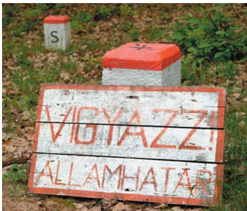
Turistáké lesz a tiltott övezet

e engedélyünk a Bükki Nemzeti Parktól a sátrazáshoz. Megvallottuk, hogy nincs, de amikor megtudták, hogy jelzést festők vagyunk, azonnal továbbálltak. Még időm se volt megkérdezni tőlük, ha zavarja a Nemzeti Parkot, hogy turisták sátraznak az erdőben, a turistaház tönkretétele nem zavarta önöket? Jó, tudom, nem ezeket a fiatalokat kellene erről kérdezgetni, hanem mondjuk Teszári bácsit, a Főnök urat és a többieket.