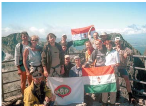
A Lomnici-csúcs tetején

A csapat nagyobbik felével aznap a Rysyre (2499 m) indultunk. Minden túratáborunkban szerepel ez a túra. A kétórás Tengersizem-csúcs a Tátra főgerincének