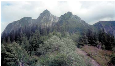
Giewont (1894 m) az alvó lovag