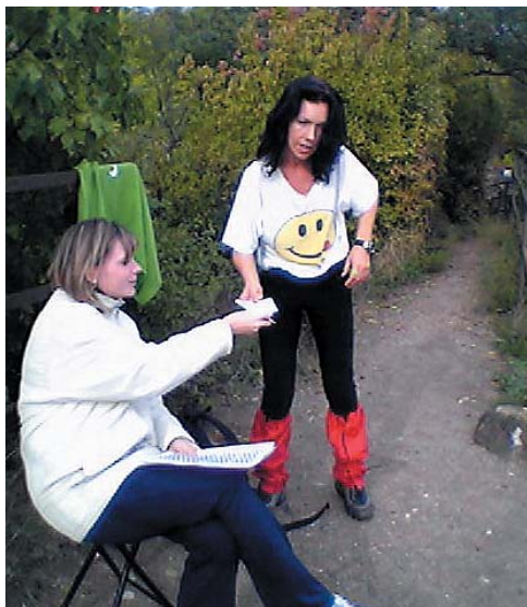
37 km-es távolság megtétele utáni ellenőrzési pont a sziklaszirten lévő Szarvaskői várban

Részletes beszámoló a 4. oldalon kezdődik.