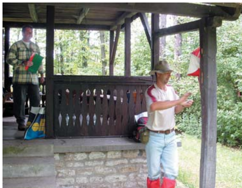
A bélyegzés pillanata

Felsőtárkány-Stimeczház kisvasút nyomvonalát. Ezt követve Varróház esőbeállóban volt a következő, a 4. ellenőrzés. Ekkor túrázóink már 23 km-t mentek, majdnem a táv felét tették meg. Bizonyára nem sokat törődtek a varróházi vadaspark egyetlen lakójával, a hatalmas szarvasbika látványával, hiszen még közel harminc kilométer volt hátra. Ebből a Les-házig kellett ledolgozni 10,5 km-t, elég változatos domborzatú tájon haladva. Az út további része a Nyírjes felé vezetett, ami egy szakaszon követte a régi vasúti vonalát. Majd a Hosszú-lápa-orom–Körtvélyes-tető–Korozs-kő–Dianna-lápa, piros alapszínű turista útvonal elvezetett a Berva-völgybe.