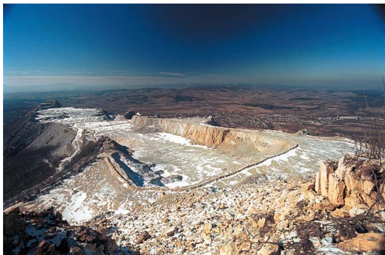
Barangoljunk együtt... a Bélkőre