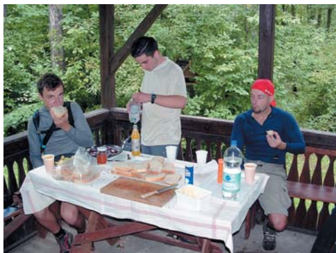
Energiafelvétel a Les-házban

Ennyi kalandozás után visszatérve a teljesítménytúrához, a tavak melletti Eger-Lillafüred műutat keresztezve Bujdosó-kőbérc mellett felkapaszkodva a dombra folytatódott a loholás. Majd egy pihentető ereszkedést követően megpillantottuk a