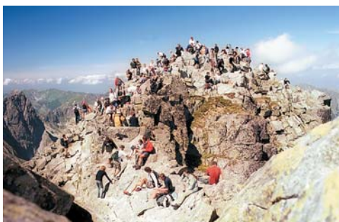
Egy augusztusi hétköznapon a népszerű zarándokhely a Tengerszem-csúcs (Rysy, 2499 m)