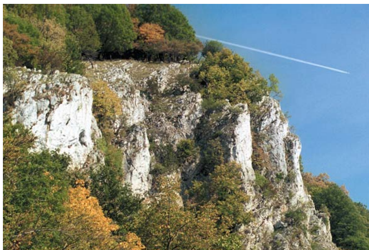
Barangoljunk együtt... a Peskőre

A KEE immáron másadszor próbálja önmagát és tevékenységét ezúton bemutatni. Az idej, a 2004-es falinaptár tátrai felvételekkel invitálja barangolásra a nézőt. Most ízelítőül egy képelőzetes a 2005-ös kiadványból.