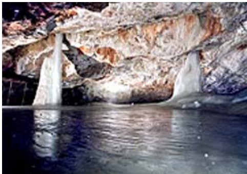
Dobsinai jégbarlang részlete