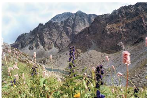
A Betyár turistaház felé vezető út részlete