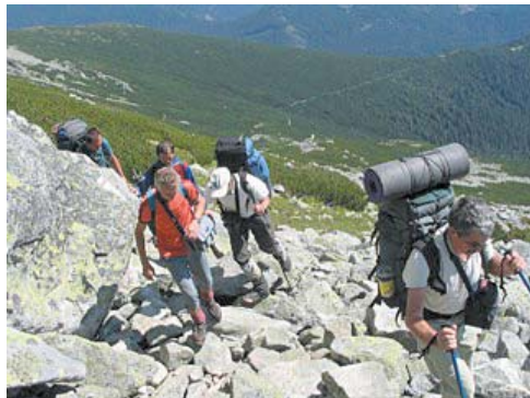
A csapat a tátrai turista-főútvonalon, a Magisztrálén