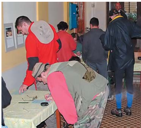
Az indulást megelőző regisztráció

egészen az Oldal-völgyi halastavakig lefelé kellett menni. E tavakat a közszáj békásnak becézi, mert az erdei békák ide járnak szaporodni. Tavasszal, az erdőkből a tavak felé vándorló békák tömege a műutat keresztezve pusztul el, ezért a természetvédők, társadalmi összefogással évről-évre békamentő akciókat szerveznek itt. Az idén 2500 békapárt segítettek át a veszélyes útszakaszon.