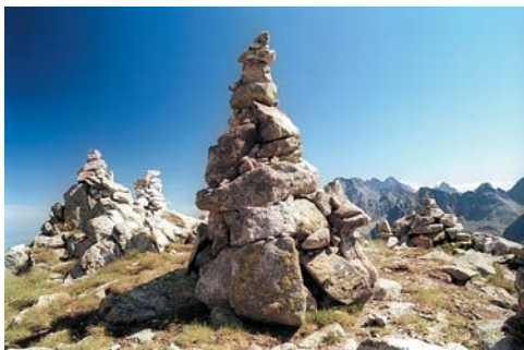
Az építkező turisták a Tengerszem-csúcs felé vezető úton