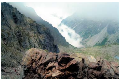
Panoráma a Vöröstorony-hágóból