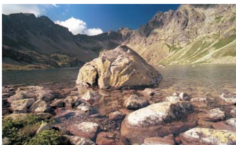
A szlovákiai Tátra legnagyobb és legmélyebb tava, a Hincó-tavak katlanában elhelyezkedő Nagy-Hincó-tó