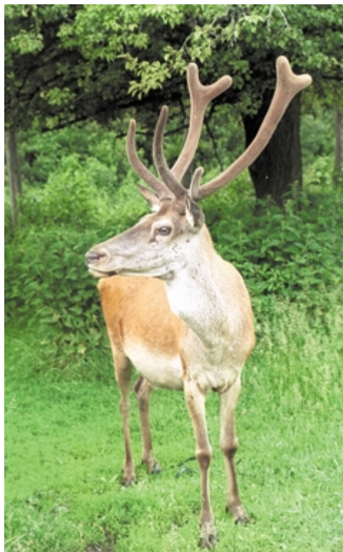
Kárpótlásul az elszalasztott muflonok helyett, egy szarvas jól sikerült fotója