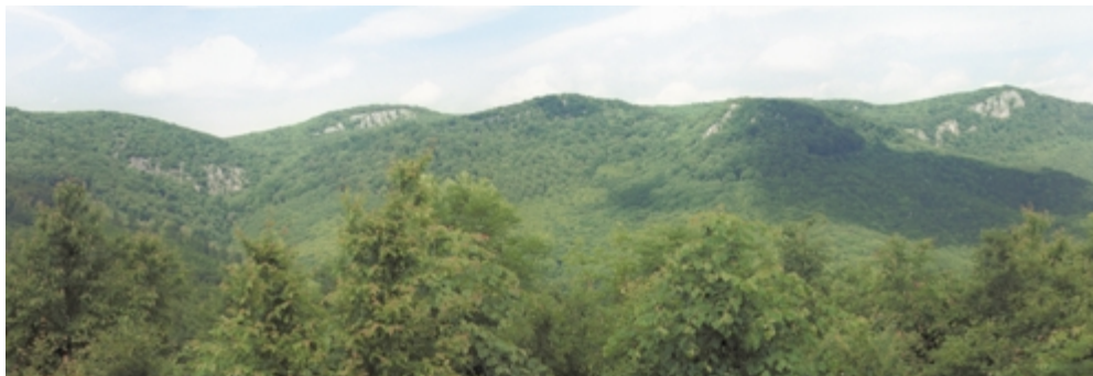
Részlet a Bükki-kövekből:

Sándor-hegy (870 m), Őr-kő (880 m), Oltár-kő (855 m), Hegyes-kő (792 m), Pes-kő (857 m)