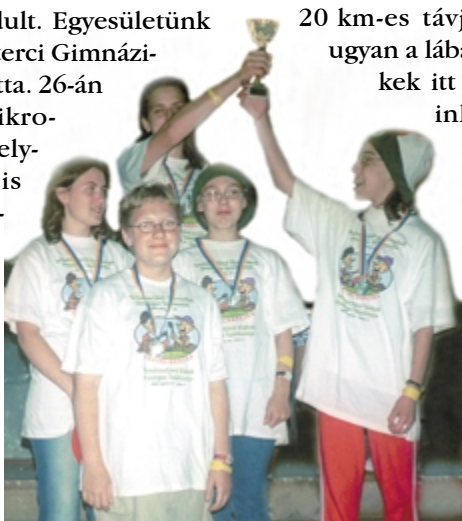
Nagycserkészek csapata az országos összetett II. helyezés díjátadásán.

lényege, hogy a térképen megjelölt pontokat meghatározott idő alatti sorrendben kell felkeresni. A nehézséget az éjszakai körülmények jelentik. A második napon szükség volt a tájékozódási képességre, és a műveltségre is a városismereti számban. Bár Kazincbarcika nagyon fiatal város (50 éves), azért akad itt is látnivaló, hiszen a települést a szobrok városának is nevezik. Még két versenyszám maradt hátra, a nappali természetjáró, valamint az elméleti verseny. Mind a kettőn próbára teszik a versenyzők elméleti tudását biológiából, földrajzból, történelemből. A nappali versenyen tájfutó ismeretekre is szükség volt. A teljesítménytúra 20 km-es távja már nem hiányzott ugyan a lábakból, azonban a gyerekek itt is helytálltak. Csapatunk közül a nagycserkészek – az Egri Csillagok összetettben az országos 2., a Gubacsok a nappali tájékozódási versenyen 3. helyezett lett. Az újoncok is derekasan kiállták a próbát. S már most elhatároztuk, hogy jövőre Pécs-Abaligetén is ott leszünk, 2006-ban pedig pályázni fogunk a rendezési jogért.