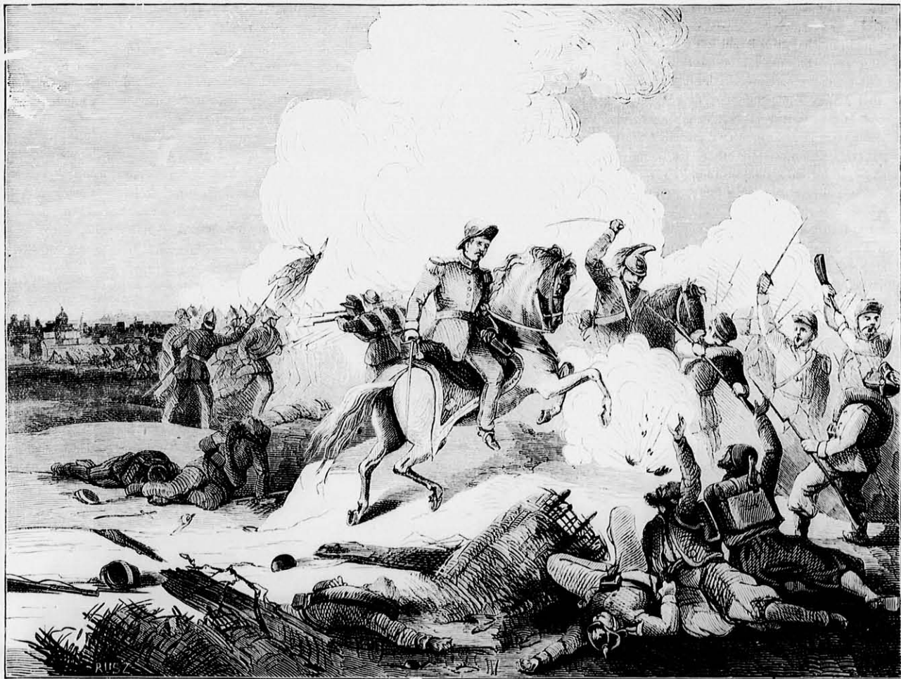
A Párisalatti harcokból. („Megörtem a nagy kitüntést, hogy a köztársaság katonái a legiszonyabb tüze és közt megöljeneztek engem.” Trich'sz sz. m.) Eredeti rajz.

A szászvárosi esata alkalmával Bemnek egyik ágyuját egy csapat ellenség rohammal foglalja el; Bem közéjük loval, egyet ostarával arba csap, mondván: „Nem látjátok, hogy ez az én ágyum;