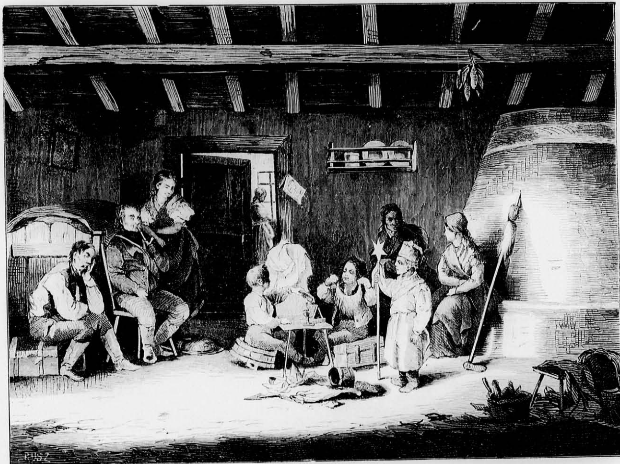
Vizkeresztkor „három királynak” készülő gyermekék. Saját olajfestménye után tén rajzolta Böhm Pál.

Később már sebei miatt lóra ülni nem tudott,