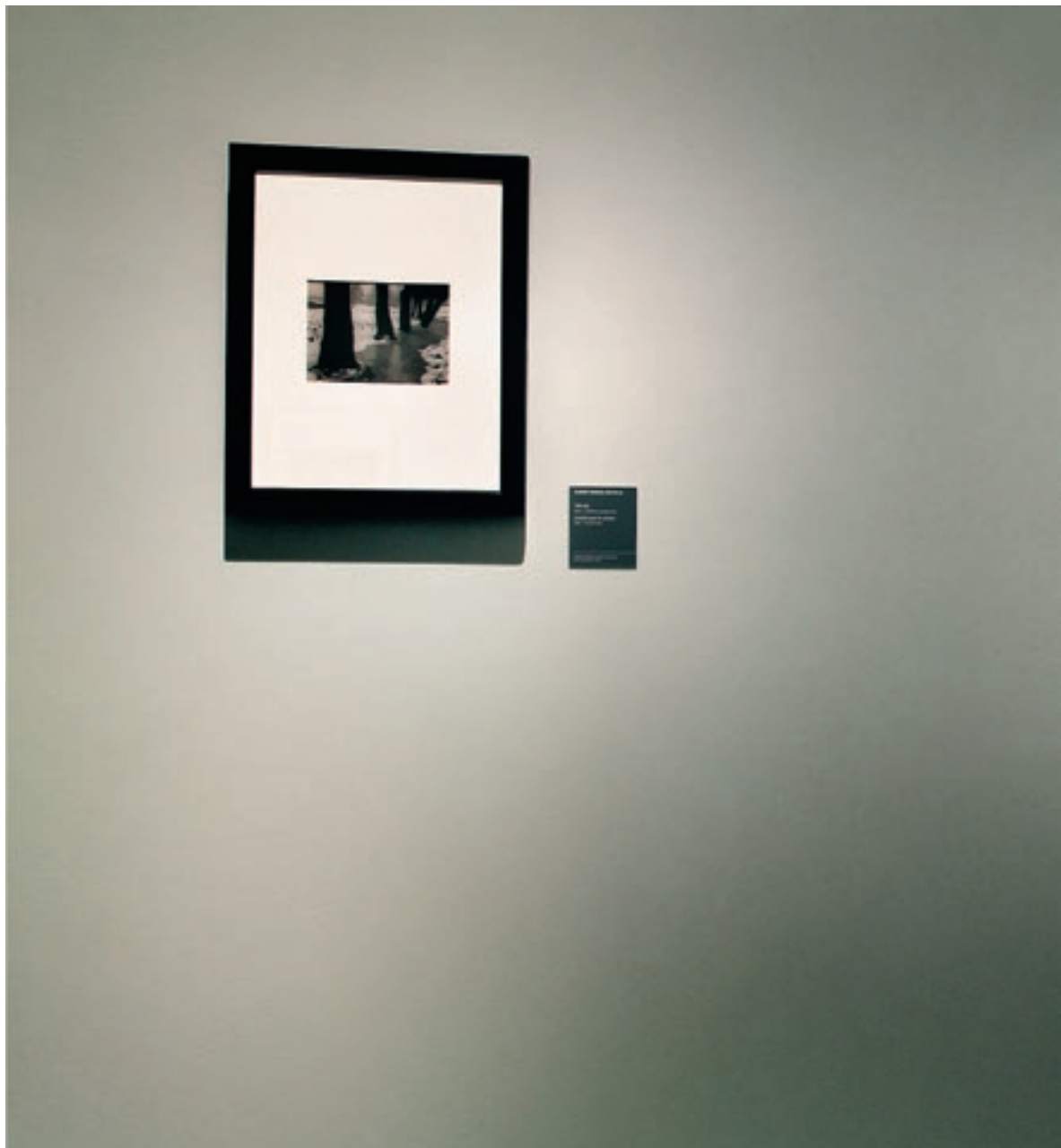
A fotóművészet születése című kiállítás a Szépművészeti Múzeumban, 2012