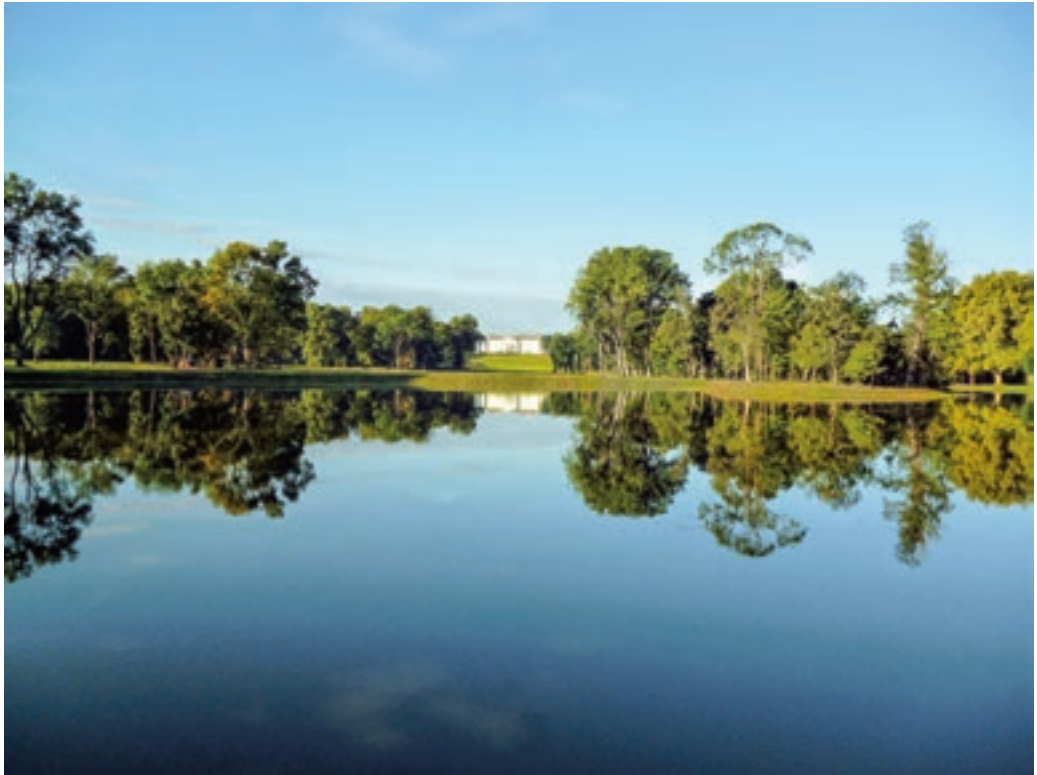
Doba, a nagy halastó a helyreállítás után © Horváth Tamás felvétele, 2015