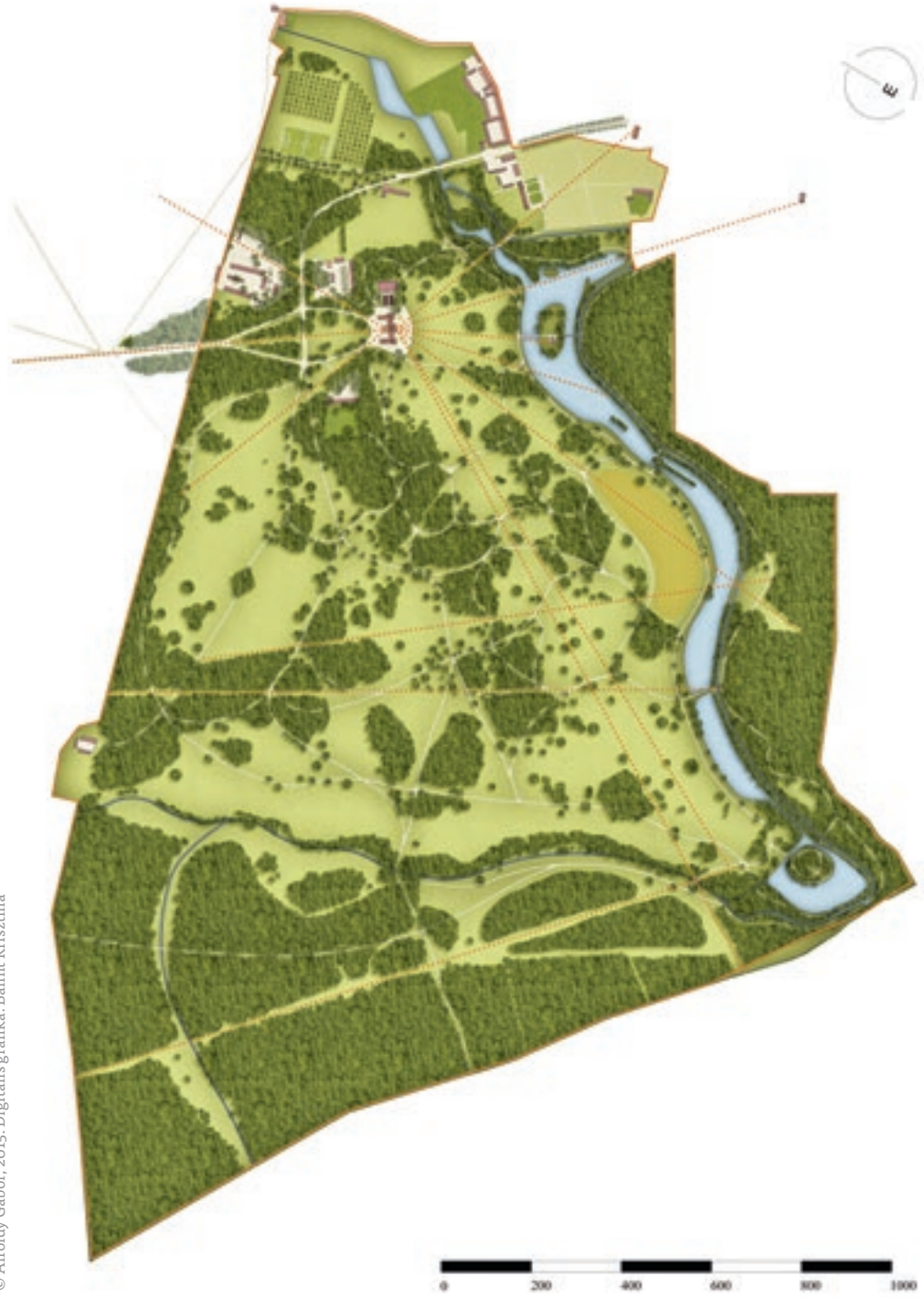
Dég, a Fesztetics-kastélypark rekonstrukciós ideálterve © Alföldy Gábor, 2015. Digitális grafika: Bálint Krisztina