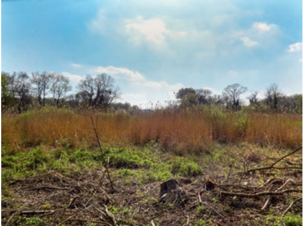
Doba, a somlói kastélypark nagy halastavának kiszáradt és elbozósodott medre a helyreállítás előtt © Alföldy Gábor felvétele, 2014