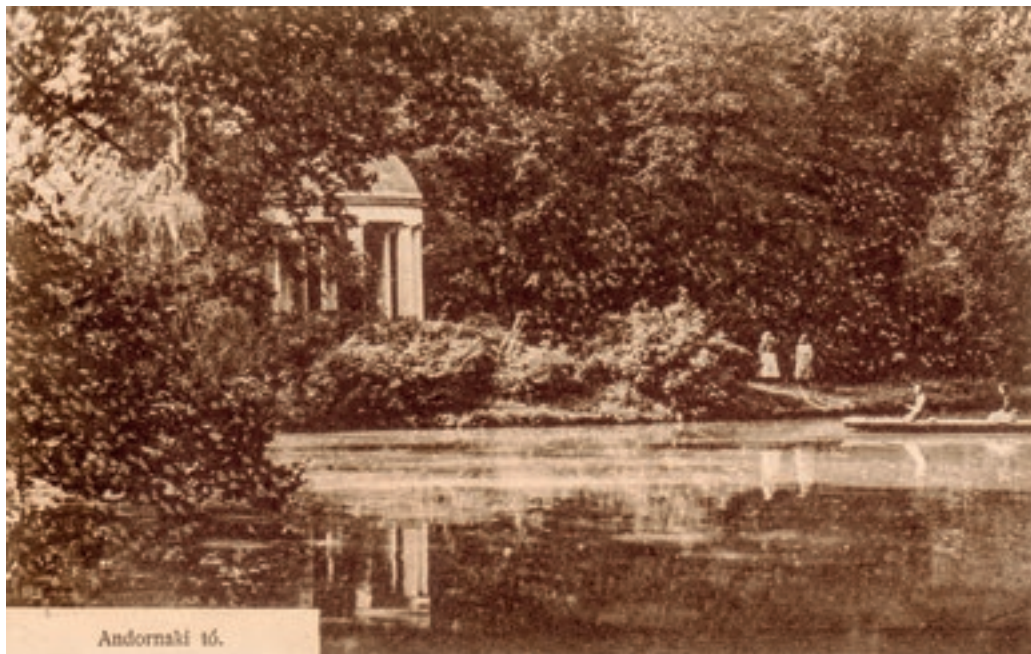
Andornaktálya, a tó és a szigeten álló gloriett Képeslap, 1912