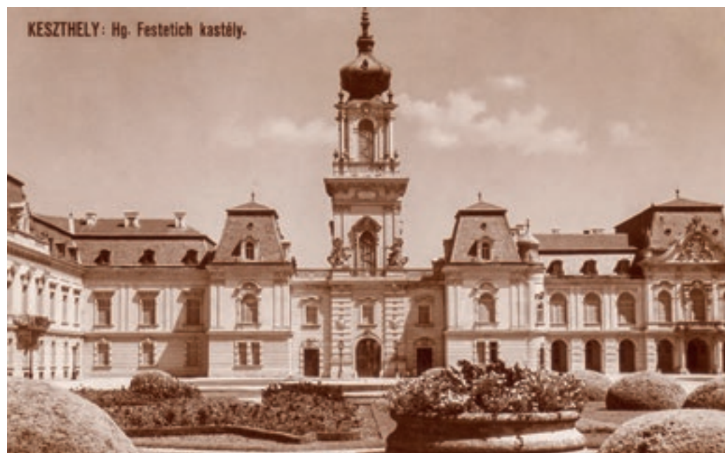
A keszthelyi Festetics-kastély a neobarokk parter („franciakert”) felől Uy Kálmán felvétele. Képeslap, 1934 © Alföldy Gábor kerttörténeti gyűjteményéből