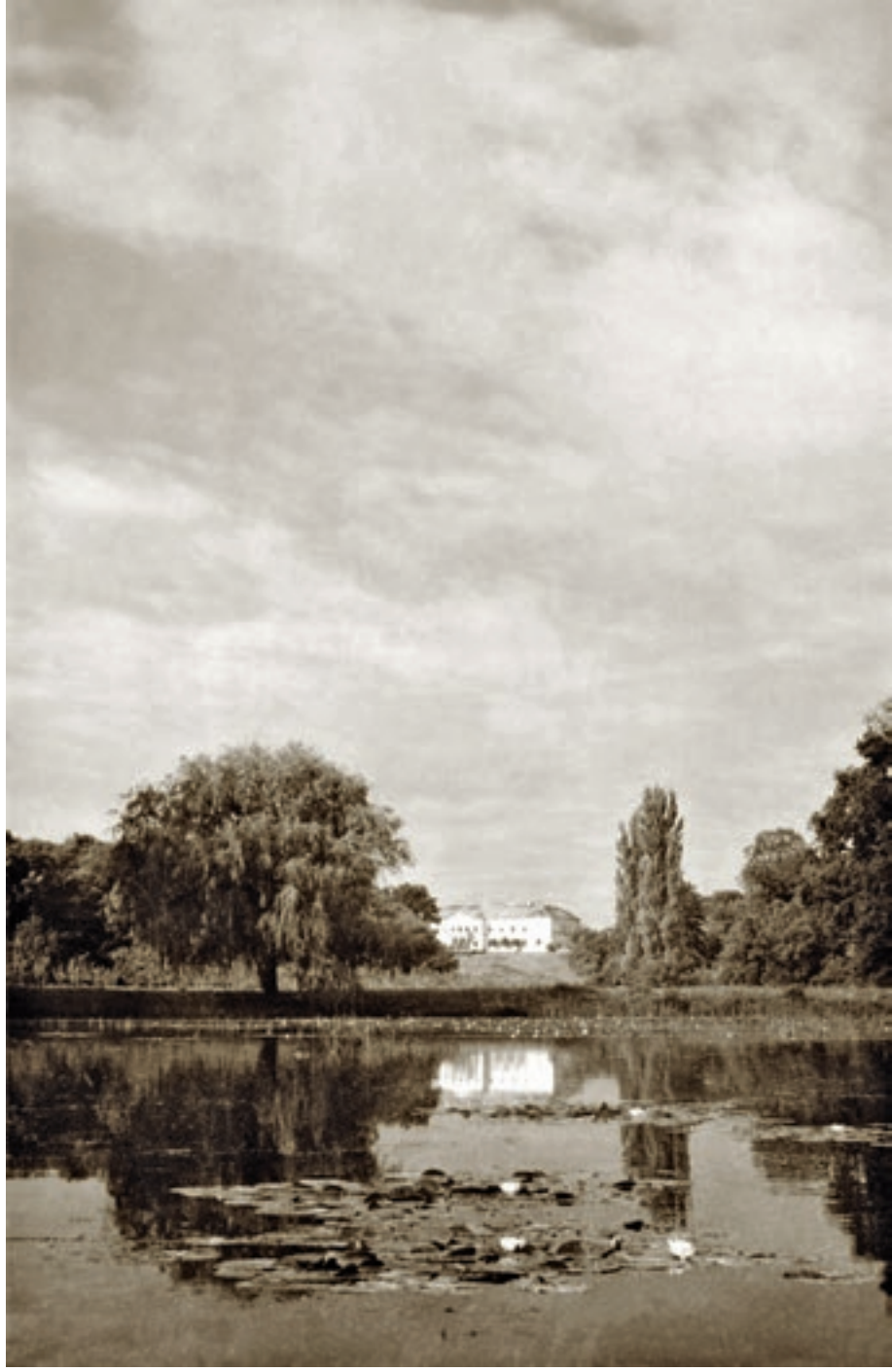
Doba, a somlói vári Erdődy-kastély a park nagy halastava felől 1968 körül