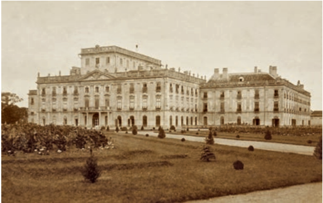
Eszterháza, a rózsakert

Fotográfia, 1910 körül