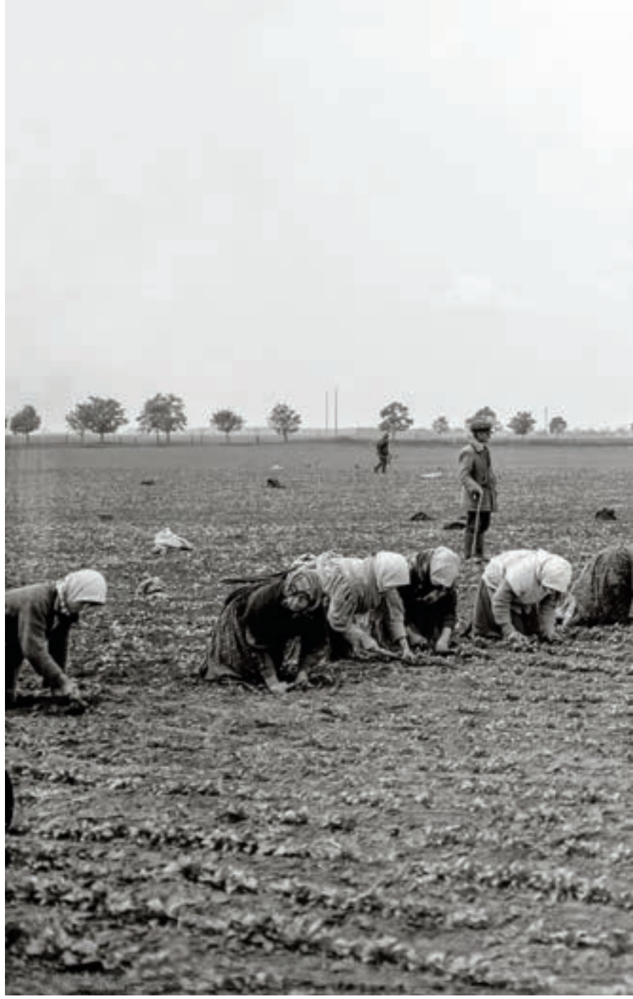
Répaegyelés Mezőhegyes, Csanád vm., ismeretlen fényképész felvétele, 1940