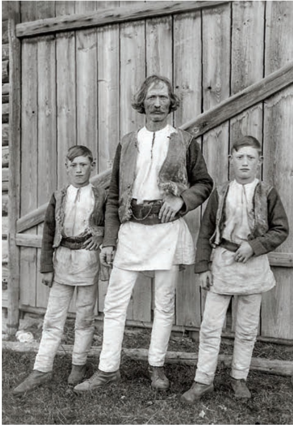
Csángó férfi fiaival Gyimesközéplok, Csík vm., 1912